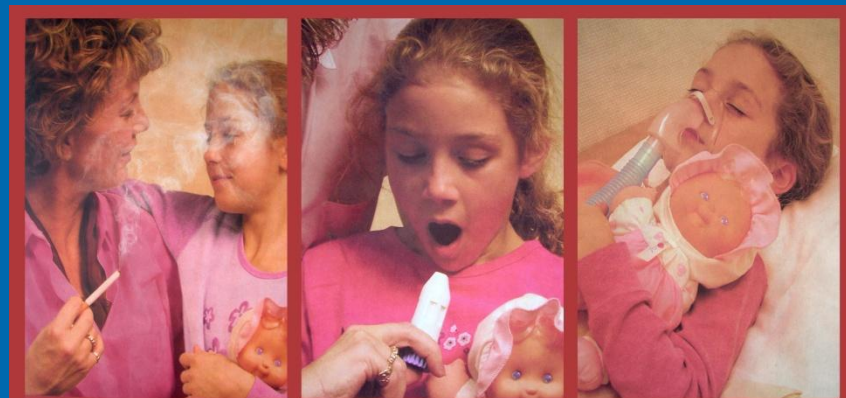
Астма: 1 000 000 детей, болеющих астмой, страдают из-за пассивного курения!

У детей из семей, где один или оба родителя курят дома, чаще возникают простудные заболевания, бронхит и пневмония. Эти дети чаще болеют в раннем детстве, чаще пропускают школу и вообще получают меньший запас здоровья на будущую жизнь. Курение родителей на 20-80% увеличивает риск заболевания дыхательной системы, тормозит рост легких ребенка. Воздействием на респираторную систему ребенка пассивного курения не исчерпывается его сиюминутное токсическое влияние на организм: даже после подрастания остается разница в показателях умственного и физического развития в группах детей из семей курильщиков и некурящих.