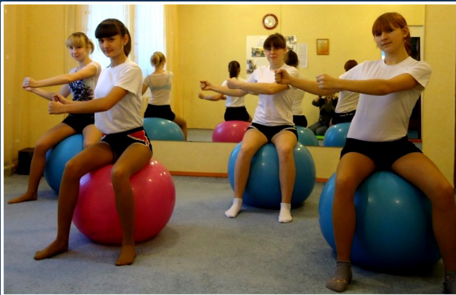
Упражнение « Боковой выпад»