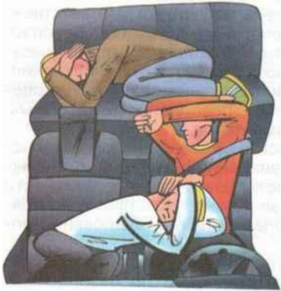
Позы водителя и пассажиров при неизбежности столкновения