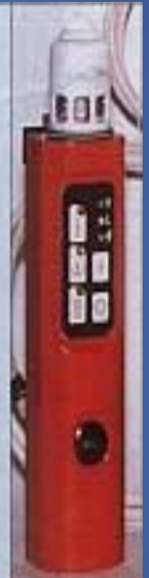
Индивидуальный автоматический газосигнализатор