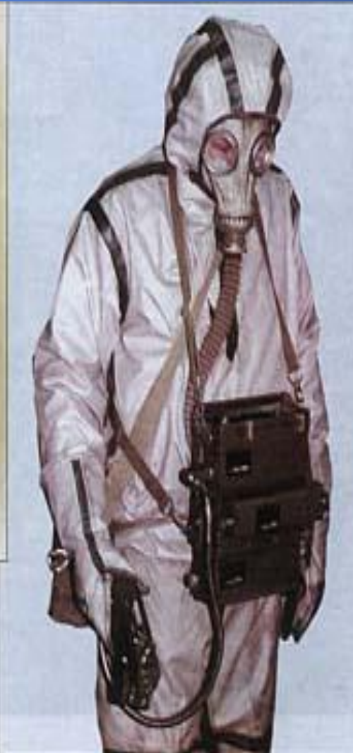
Универсальный прибор газового контроля