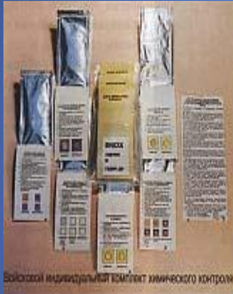
Бойковой индивидуальный комплект химического контроля