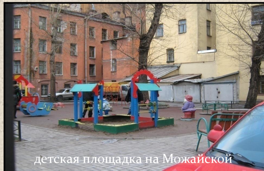
детская площадка на Можайской