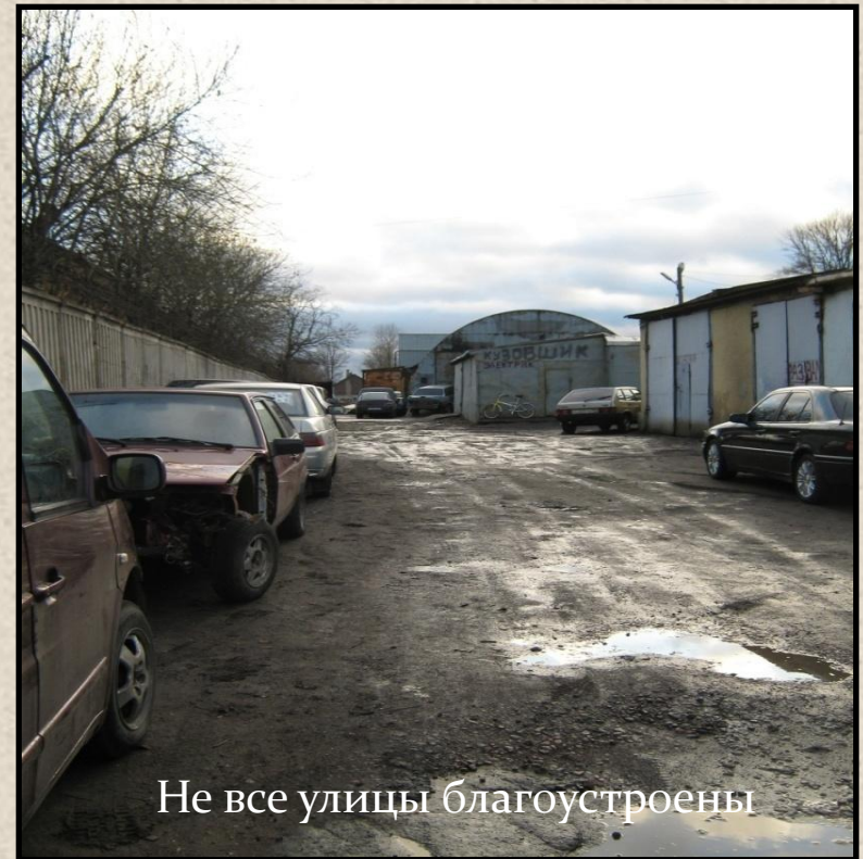
Не все улицы благоустроены

90% домов были построены до 1917 года, а из 49 тысяч квартир 18753- коммунальные. В районе самое большое число в городе аварийных квартир.