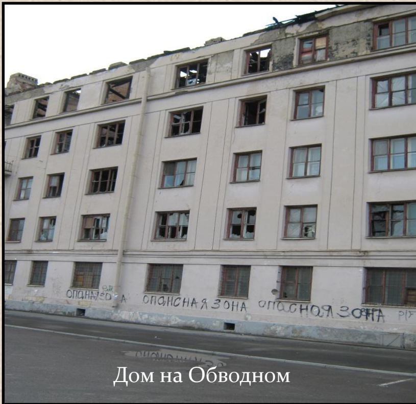
Дом на Обводном