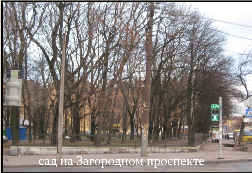
сад на Загородном проспекте

Только 43% учащихся школы могут отдохнуть в ближайших садах и парках разных районов города.