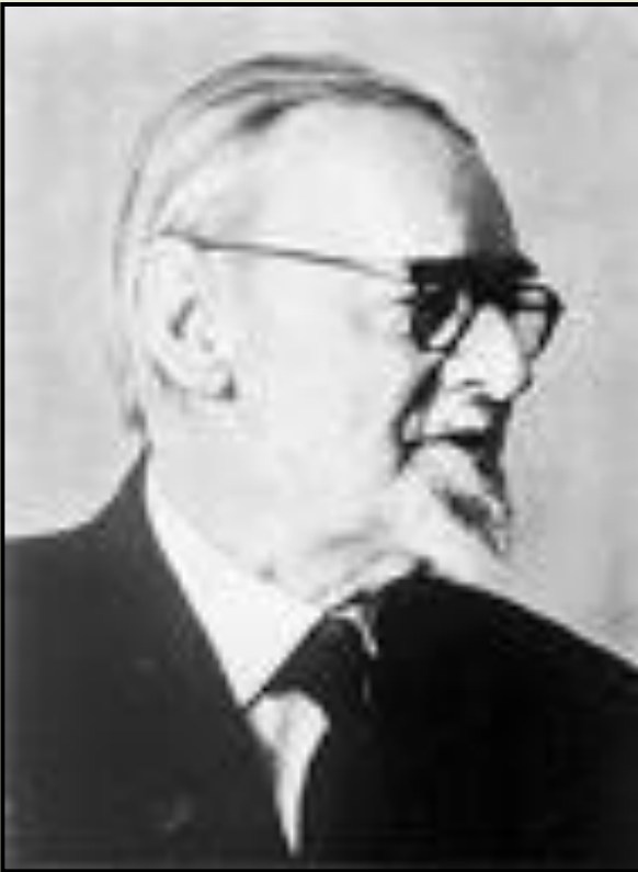
Н. А. Бернштейн