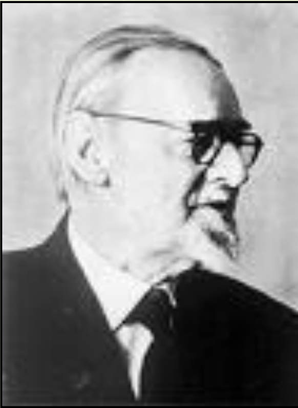
Н. А. Бернштейн