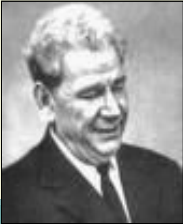
П. К. Анохин

Всю деятельность системы и ее всевозможные изменения можно представить целиком в терминах результата :