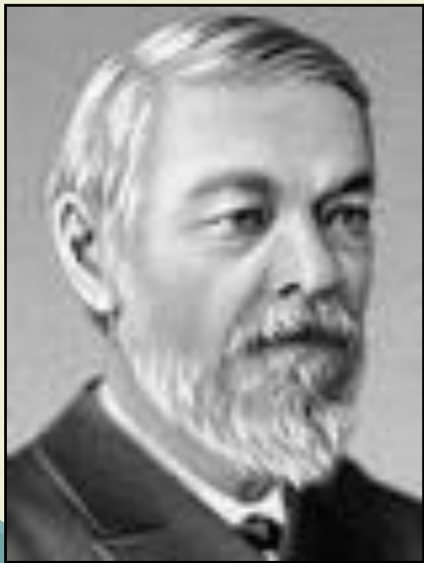
И. М. Сеченов

«Жизненные потребности рождают хотения, и уже эти ведут за собой действия : хотение будет мотивом или целью, а движение – действием или средством достижения цели. Без хотения как мотива или импульса движение было бы вообще бессмысленно...»