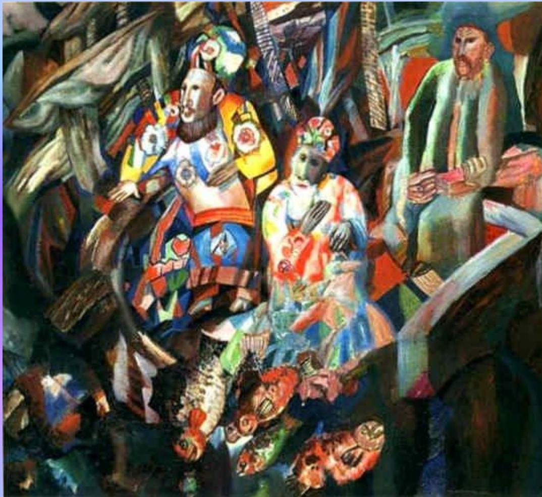
«Запад и восток».