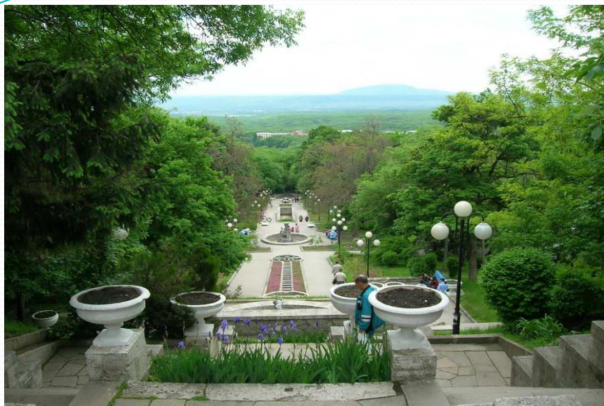
Каскадная лестница в парке

Сегодня сердце Железноводска – это Лечебный парк. Он большой, в нем много зелени и чистый воздух.