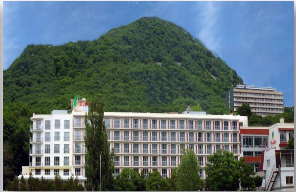
Санаторий им. Э. Тельмана (1907г. постройки)