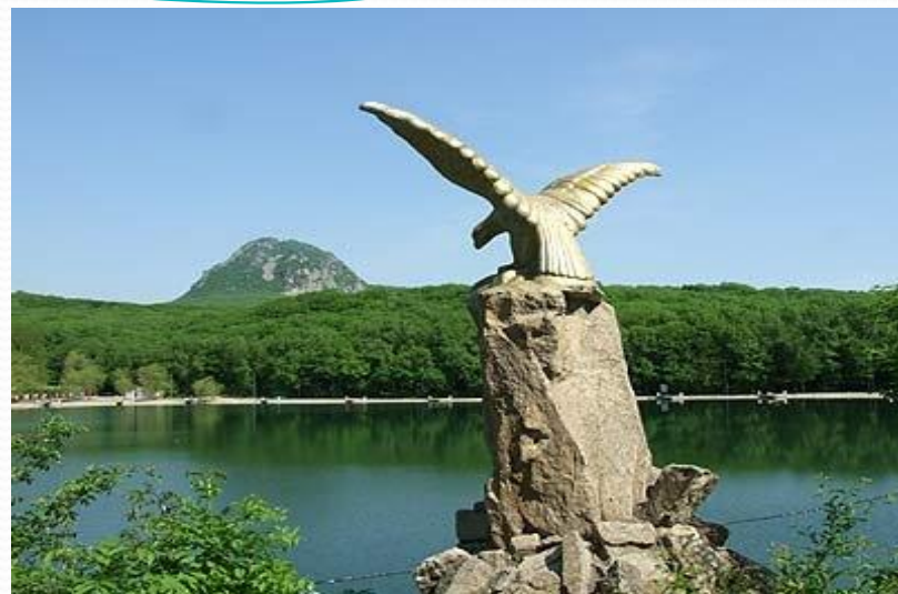
Символ города Железноводска

В нашем городе даже жил великий русский поэт Михаил Юрьевич Лермонтов.