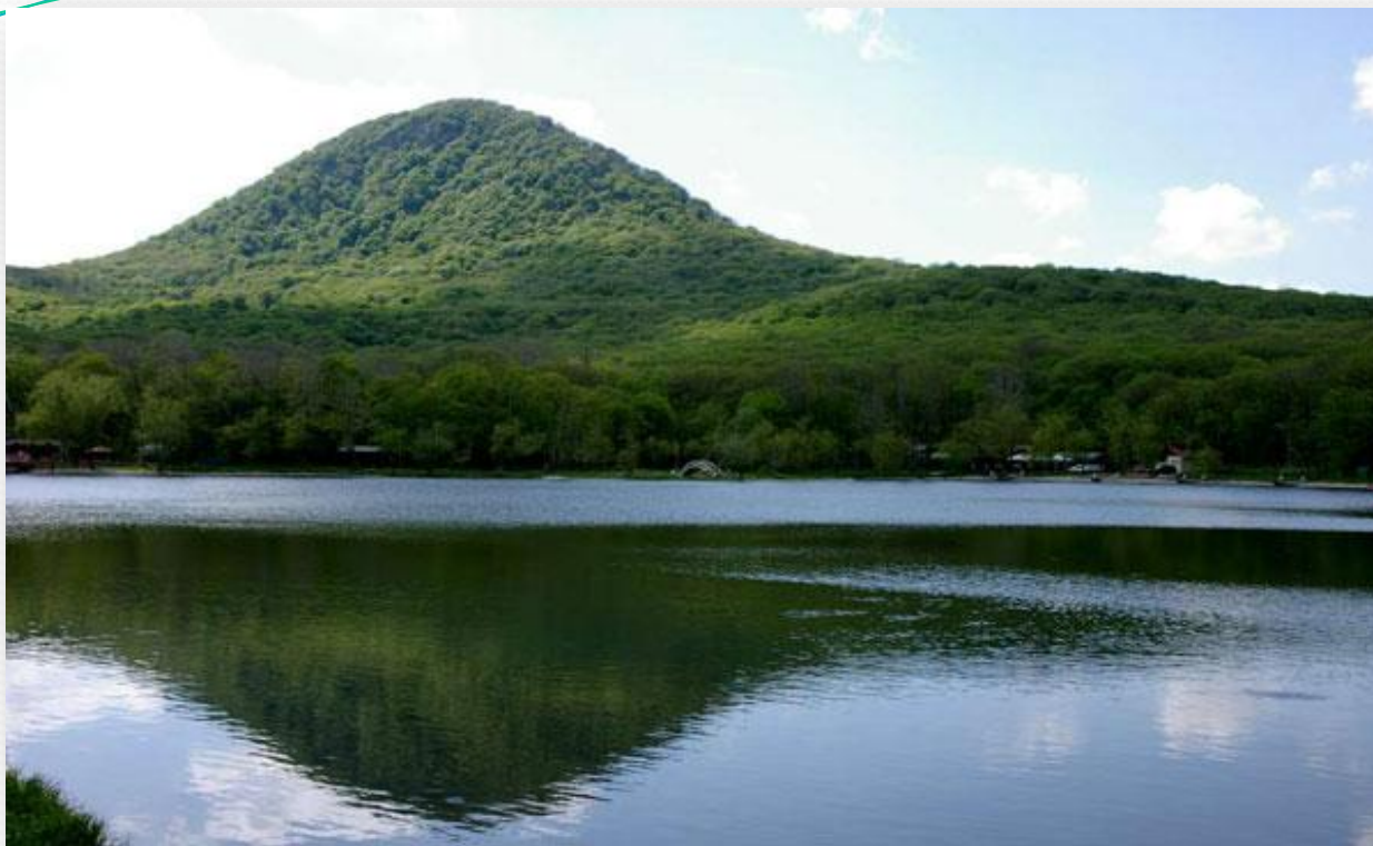
Городское озеро и вид на гору Железная

Город со всех сторон окружен горами: Железной, Бештау, Змейкой, Кинжалом, Верблюдкой. В ясную погоду видны белоснежные вершины красавца Эльбруса!