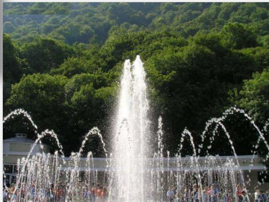
Цветной фонтан в парке

В нем есть два бювета с водой, красивый фонтан,