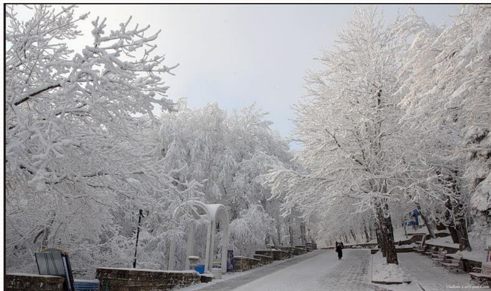
На центральной аллее парка

Сегодня сердце Железноводска – это Лечебный парк. Он большой, в нем много зелени и чистый воздух.