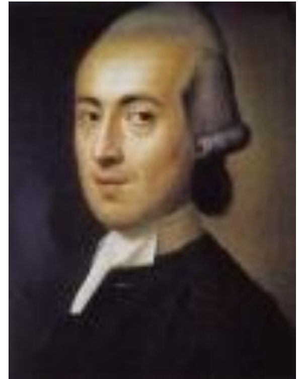
ИОГАНН ГЕРДЕР 25.08.1744 – 00.00.1803

Термин «политическая культура» впервые появился лишь в XVIII в. в трудах немецкого философа-просветителя Иоганна Гердера. . Теория же, предполагавшая изучение мира политики через призму этого концепта, сформировалась еще позднее -только в конце 50-60-х гг. XX в. и получила развитие в работе американского политолога Германа Файнера «Системы правления великих европейских государств» 1956 г. Позднее была опубликована книга американских авторов Г. Алмонда и С. Вербы «Гражданская культура» (1963 г.).