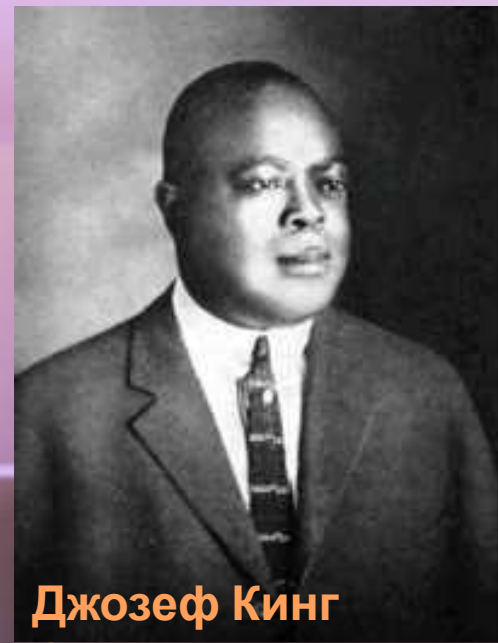
Джозеф Кинг Оливер