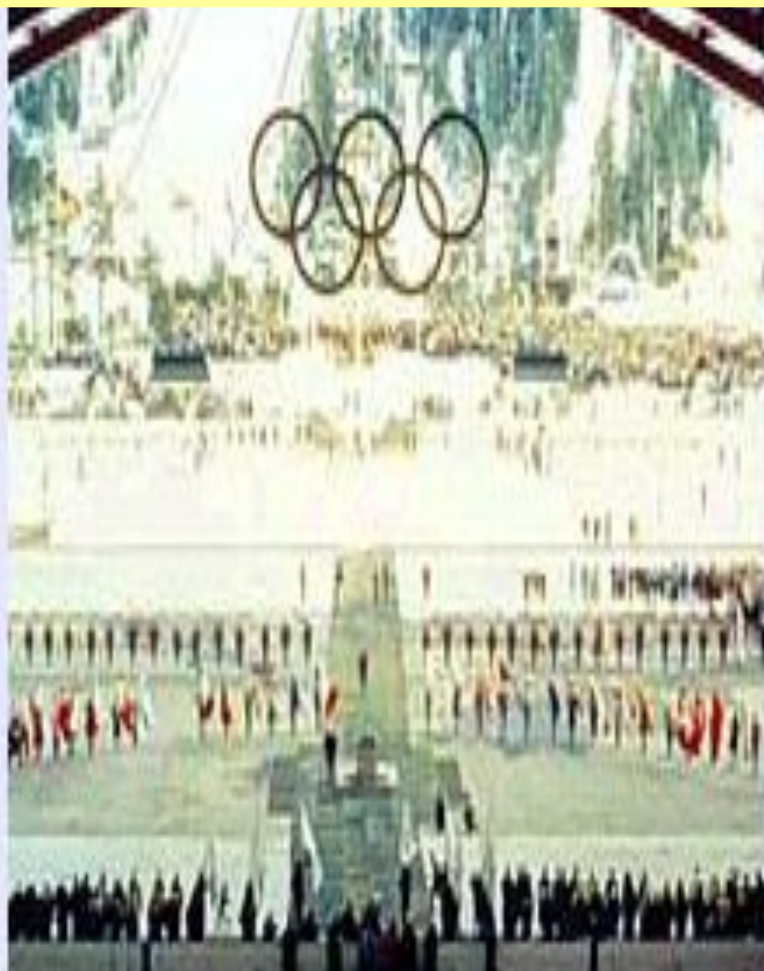
Церемония открытия Белой Олимпиады в Скво-Вэлли (1960)

ЗИМНИЕ ОЛИМПЕЙСКИЕ ИГРЫ, всемирные комплексные соревнования по зимним видам спорта, проводимые с 1924 Международным олимпийским комитетом.