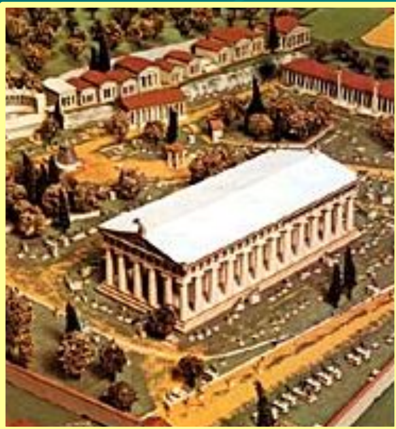
Храм Зевса в Олимпии

По мифологическому преданию, Олимпийским играм предшествовали погребальные игры в честь героя Пелопса , впоследствии возобновленные Гераклом. Пелопс и Геракл считались также учредителями первых видов состязаний: скачек на колесницах, бега и борьбы. В 4 в. до н. э. на основании реконструкции списков победителей была условно определена дата первых Игр — 776 до н. э. Установление порядка их проведения приписывалось в древности царю Элиды Ифиту, спартанскому законодателю Ликургу и ахейцу из Писы Клеосфену, заключившим (с одобрения дельфийского оракула) священный союз. Текст договора о правилах состязания был записан на бронзовом диске, о нем в 4 веке до н. э. сообщает Аристотель, во в 2 веке в храме Геры его еще видел Павсаний .