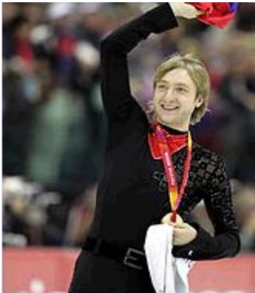
Е. Плющенко — олимпийский чемпион. Турин 2006.