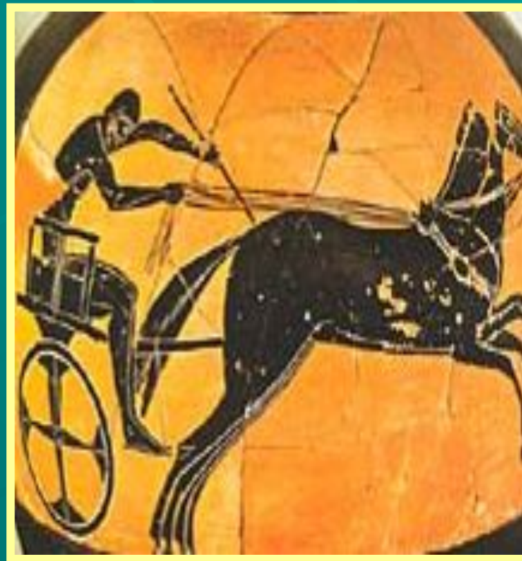
Алене – скачки на колесницах, запряженных двумя мулами