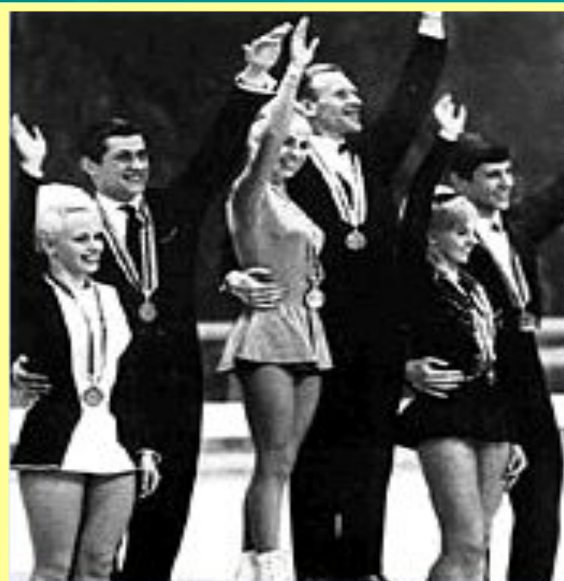
Звезды фигурного катания: Людмила Белоусова и Олег Протопопов (золотые призеры Олимпиады в Гренобле) и серебряные призеры Олимпиады Татьяна Жук и Александр Горалик.