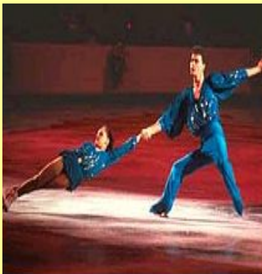
Екатерина Гордеева и Сергей Гриньков выполняют один из сложнейших элементов парного катания «тодес».