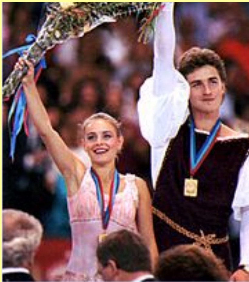
Е. Гордеева и С. Гриньков стали чемпионами Игр Доброй Воли (фигурное катание). Сиэтл. 1990 г.