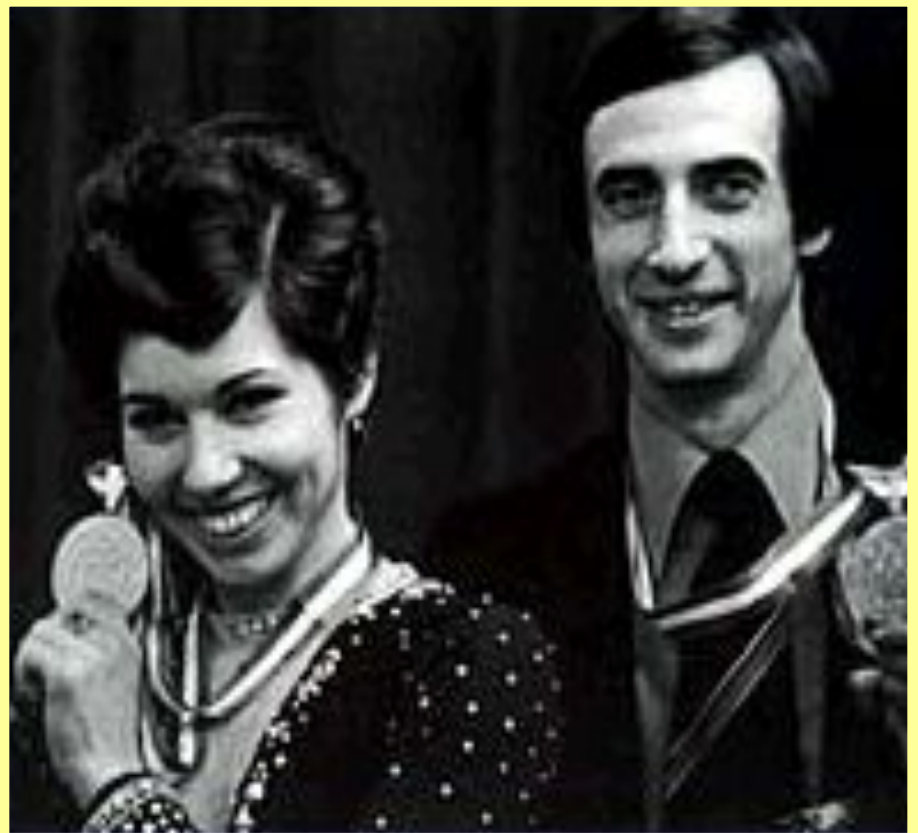
Людмила Пахомова и Александр Горшков — первые олимпийские чемпионы в спортивных танцах на льду. Калгари. (1988).