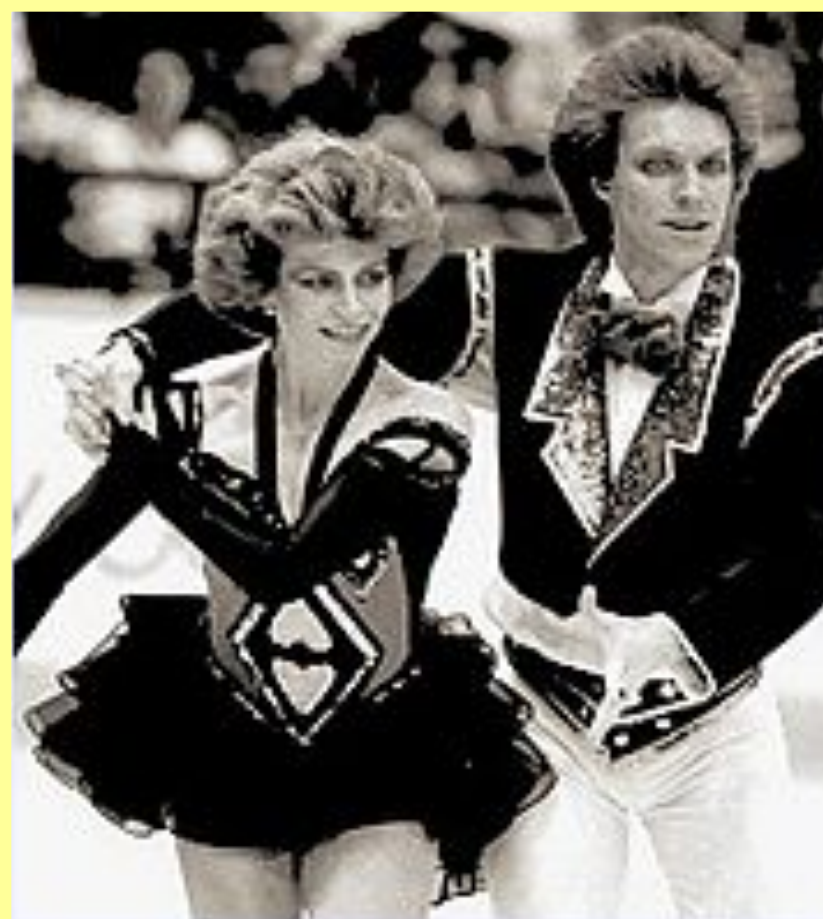
Н. Ф. Бестемьянова и А. А. Букин на XV зимних Олимпийских играх. Спортивные танцы. 1988 г.