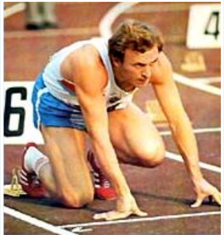
Двукратный олимпийский чемпион в спринте Валерий Борзов.