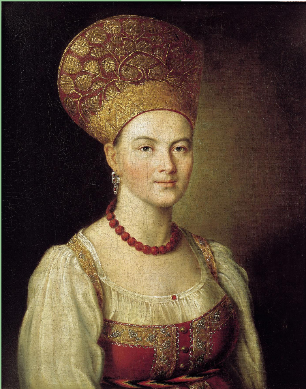
И. Аргунов «Портрет неизвестной крестьянки в русском костюме»