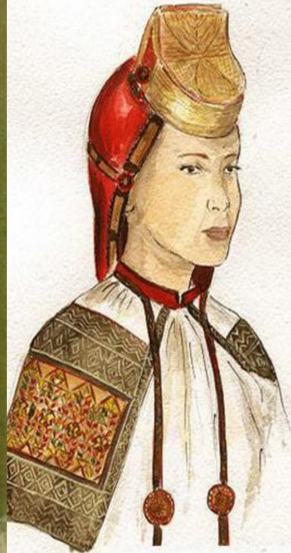
Головной убор "сорока" Воронеж конец 19 начало 20 века. (сукно, бархат, золотное шитье, гапун)