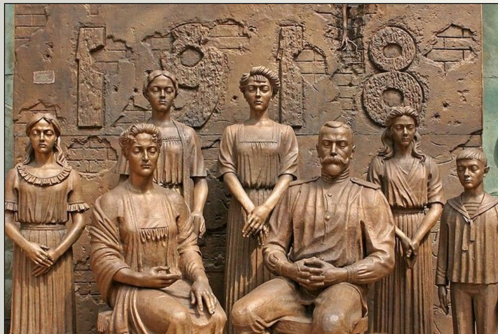
З.К. Церетели. «Ипатьевская ночь». 2007 Скульптурная композиция, посвященная расстрелу царской семьи

9 марта Николай II и царская семья были арестованы. Первые пять месяцев они находились под охраной в Царском Селе, в августе 1917 их переправили в Тобольск. В апреле 1918 большевики перевели Романовых в Екатеринбург. В ночь на 17 июля 1918 в центре Екатеринбурга, в подвале дома Ипатьева, где узники находились в заточении, Николай, царица, пятеро их детей и несколько приближенных (всего 11 человек) были без суда и следствия расстреляны.