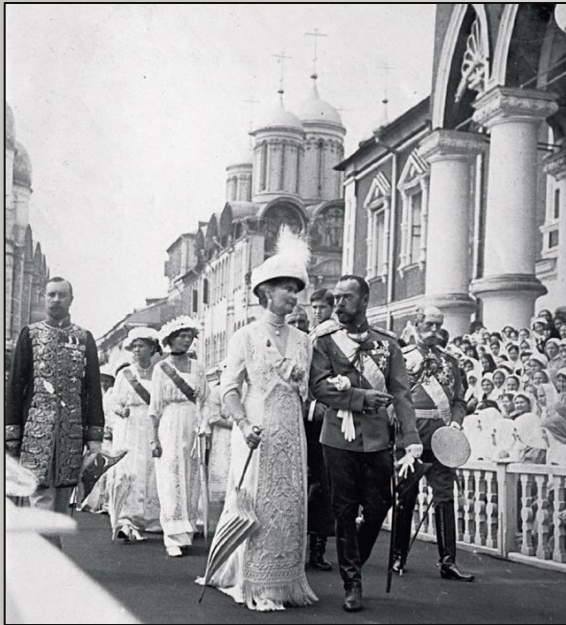
Семья Николая II во время празднования трехсотлетия дома Романовых. 1913 г.

Опорой Николая II была семья. Императрица Александра Федоровна (урожденная принцесса Алиса Гессен-Дармштадтская) была для царя не только женой, но и другом, советчиком. Привычки, представления и культурные интересы супругов во многом совпадали. Они обвенчались 14 ноября 1894. У них было пятеро детей: Ольга (1895-1918), Татьяна (1897-1918), Мария (1899-1918), Анастасия (1901-1918), Алексей (1904-1918).