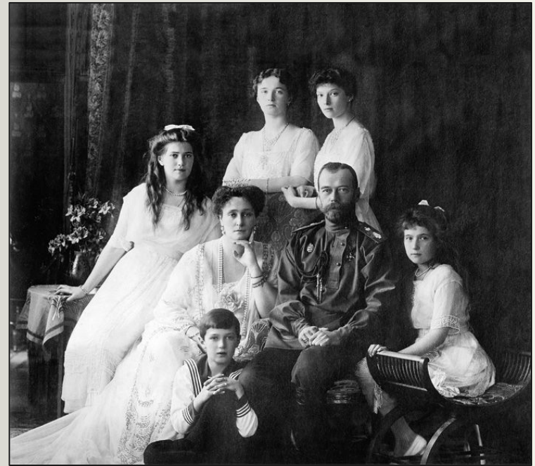
Семья Николая II: Александра Федоровна и дети — Ольга, Татьяна, Мария, Анастасия и Алексей. 1913 г.