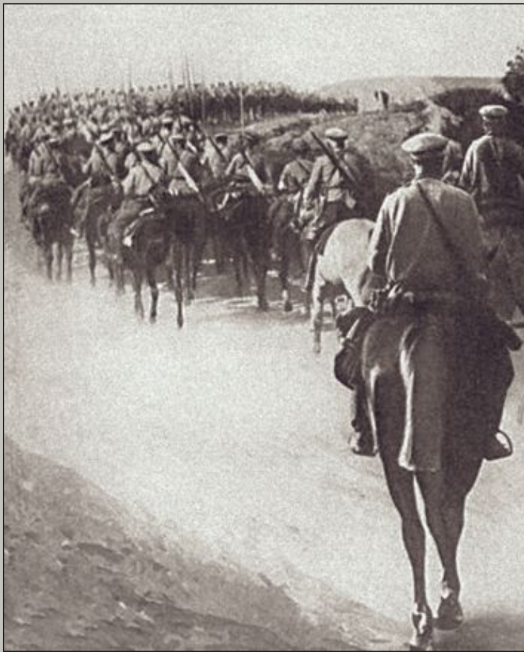
Русские войска на марше, 1915 год

Переломным рубежом в судьбе Николая II стал 1914 год — начало Первой мировой войны. Царь не хотел войны и до самого последнего момента пытался избежать кровавого столкновения. Однако 19 июля (1 августа) 1914 Германия объявила войну России.