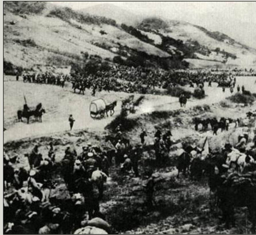
Передвижение войск. Карл Булла

Русско-японская война 1904-1905 гг. велась за господство в Северо-Восточном Китае и Корее. Война была начата Японией. В 1904 году японский флот напал на Порт-Артур, оборона которого продолжалась до начала 1905 года. Россия потерпела поражения на реке Ялу, под Ляояном, на реке Шахэ. В 1905 году японцы разгромили русскую армию в генеральном сражении при Мукдене, а русский флот - при Цусиме. Война закончилась Портсмутским миром 1905 года, по условиям которого Россия признала Корею сферой влияния Японии, уступила Японии Южный Сахалин и права на Ляодунский полуостров с городами Порт-Артуром и Дальним. Поражение русской армии в войне ускорило начало революции 1905-1907 гг.