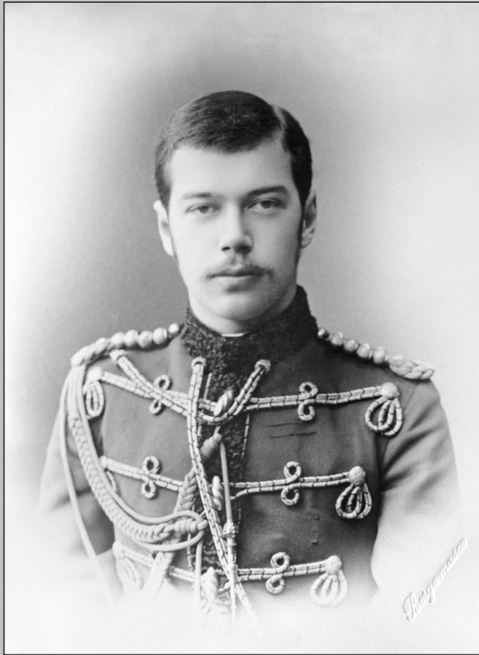
Николай Александрович, 1889 год

Николай Александрович Романов родился (6) 18 мая 1868 года в Царском селе. Он был старшим сыном императора Александра III и императрицы Марии Федоровны. По традиции Николай получил домашнее образование, соответствующее курсу гимназии. С ранних лет Николай испытывал тягу к военному делу. Сразу же после рождения он был зачислен в списки нескольких гвардейских полков и назначен шефом 65-го пехотного московского полка. В декабре 1875 получил свое первое воинское звание — прапорщика, а в 1880 был произведен в подпоручики, через 4 года стал поручиком. В 1884 Николай II поступил на действительную военную службу, в июле 1887 приступил к регулярной военной службе в Преображенском полку и был произведен в штабс-капитаны, в 1891 Николай получил звание капитана, а через год — полковника.