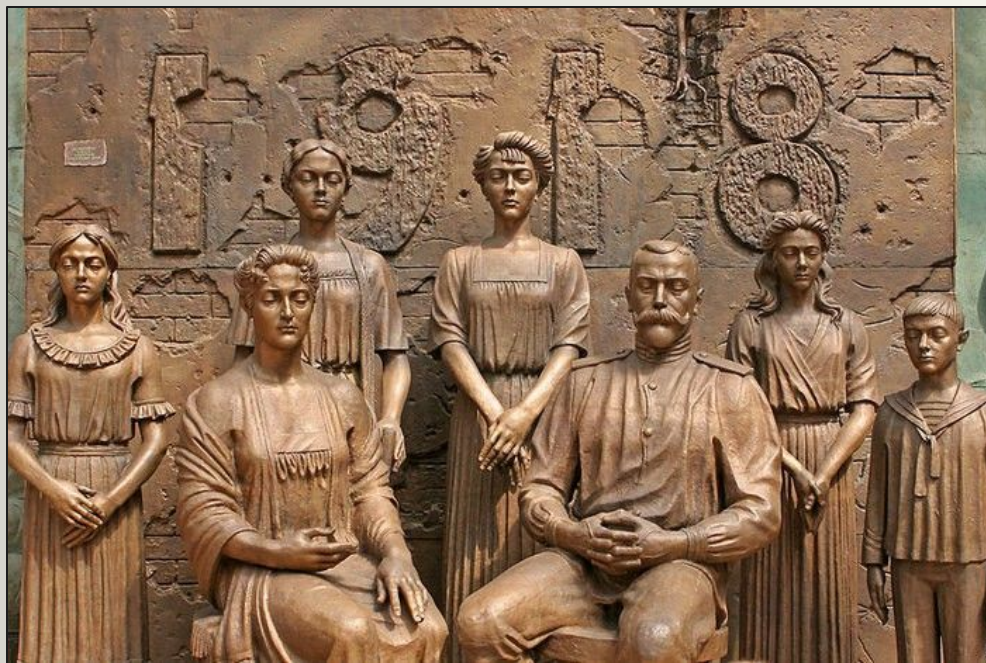
З.К. Церетели. «Ипатьевская ночь». 2007 Скульптурная композиция, посвященная расстрелу царской семьи

9 марта Николай II и царская семья были арестованы. Первые пять месяцев они находились под охраной в Царском Селе, в августе 1917 их переправили в Тобольск. В апреле 1918 большевики перевели Романовых в Екатеринбург. В ночь на 17 июля 1918 в центре Екатеринбурга, в подвале дома Ипатьева, где узники находились в заточении, Николай, царица, пятеро их детей и несколько приближенных (всего 11 человек) были без суда и следствия расстреляны.