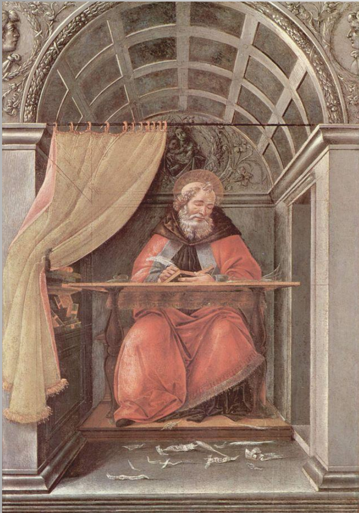
Боттичелли. «Св. Августин»

Августин Блаженный - родоначальник христианской философии истории (раздел философии, призванный ответить на вопросы об объективных закономерностях и духовно-нравственном смысле исторического процесса).