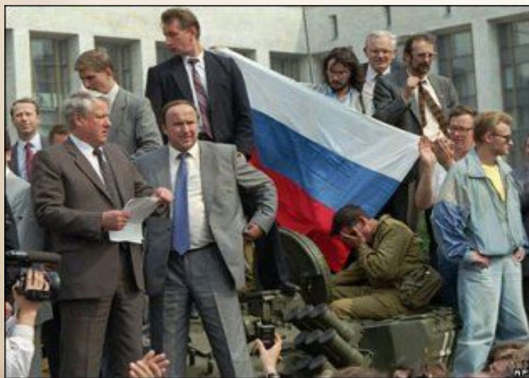
Борис Ельцин (слева) и Александр Коржаков на фоне исторического флага России. Белый дом, Москва, август 1991 года

22 августа 1991 года Чрезвычайная сессия Верховного Совета РСФСР постановила считать официальным символом России триколор, а указом Президента РФ от 11 декабря 1993 года было утверждено Положение о государственном флаге Российской Федерации. В августе 1994 года президент России Борис Ельцин подписал указ, в котором говорится: «В связи с восстановлением 22 августа 1991 года исторического российского трехцветного государственного флага, овеянного славой многих поколений россиян, и в целях воспитания у нынешнего и будущих поколений граждан России уважительного отношения к государственным символам, постановляю: Установить праздник - День Государственного флага Российской Федерации и отмечать его 22 августа».