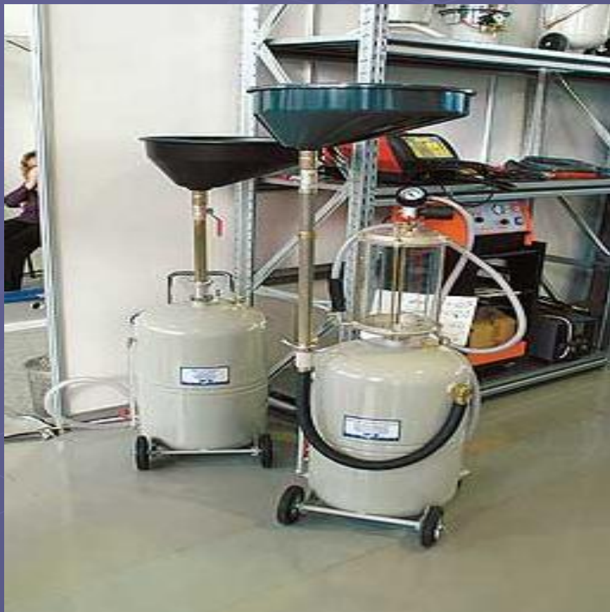
Нагнетатель автомобильных масел