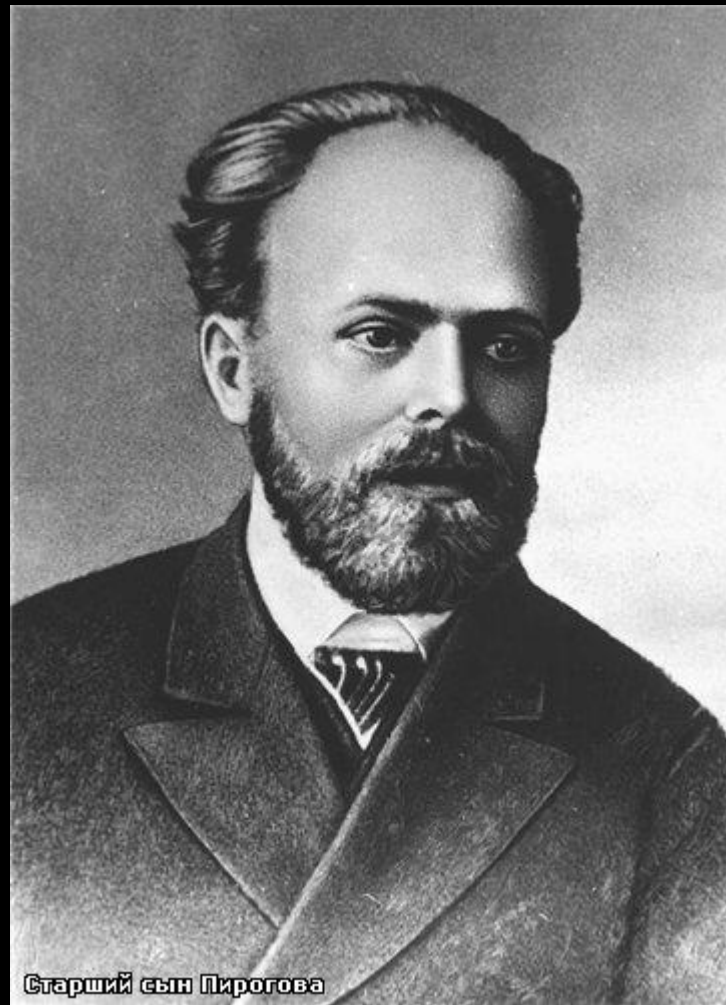
Старший сын Пирогова