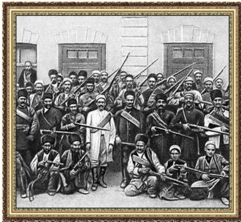
Революционный отряд на улицах Тегерана

Нач. XX века – подъем НОД в Азии. Революции: Иран (1905-1911), - Турция (1908), Китай (1911-13), + Россия , Мексика .