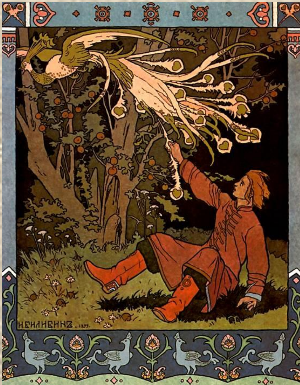
Иллюстрация к «Сказке об Иване-Царевиче, Жар-птице и Сером волке»