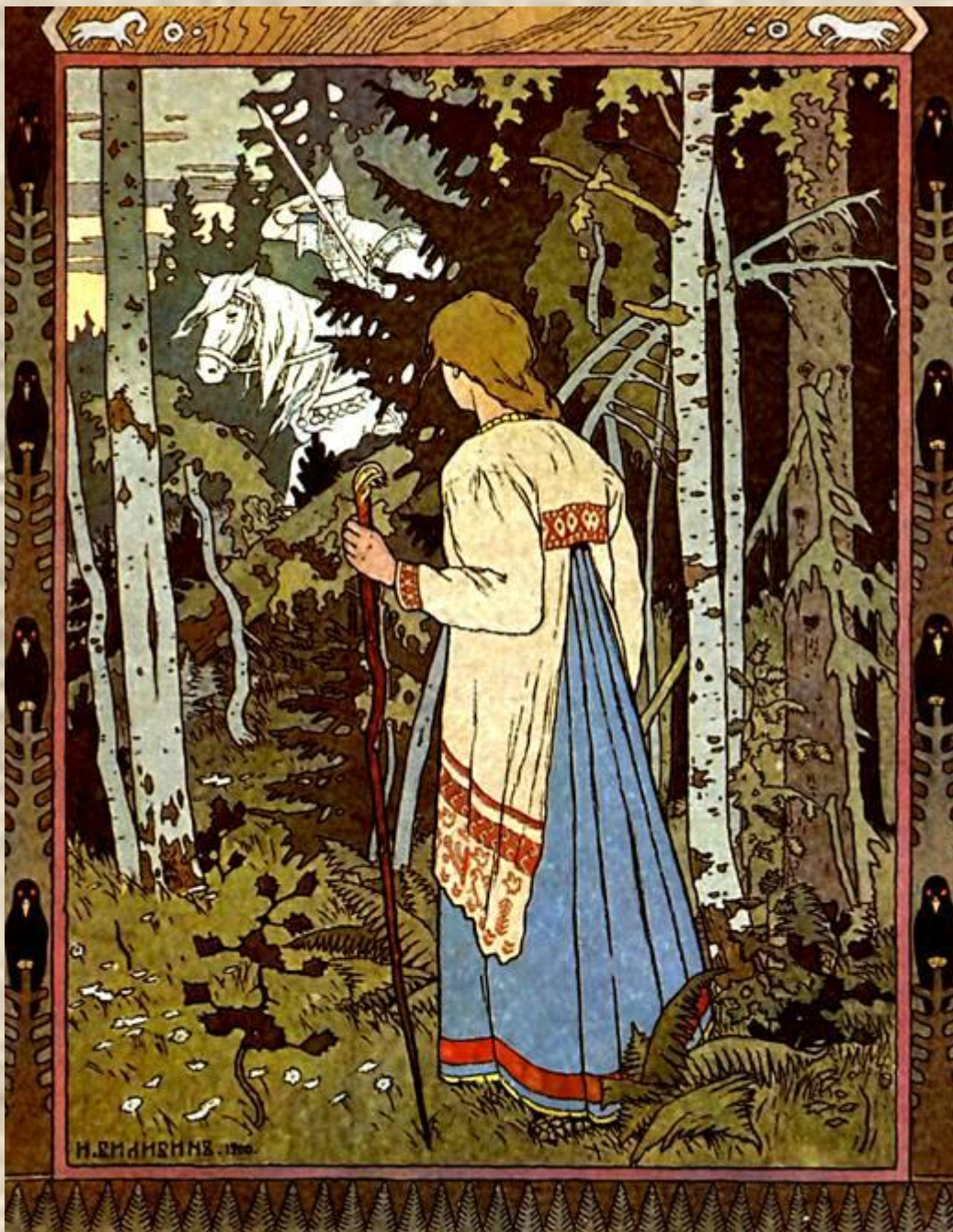
Белый всадник. Иллюстрация к сказке «Василиса Прекрасная»