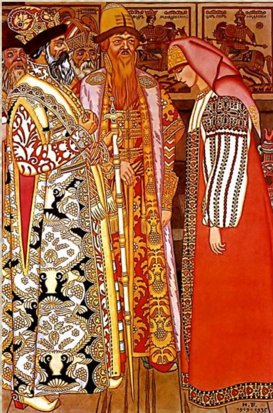
Иллюстрация к сказке «Поди туда, не знаю куда»