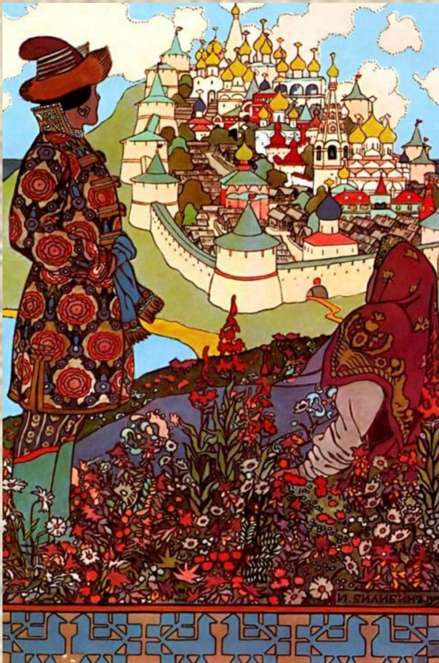
Иллюстрация к «Сказке о царе Салтане»