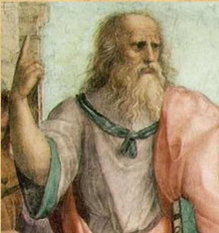
Платон на фреске «Афинская школа»