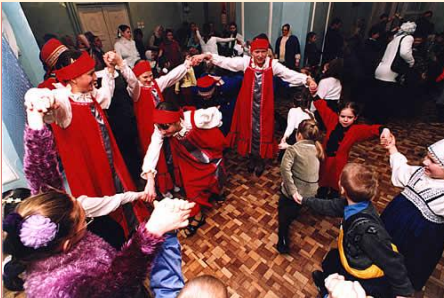
Игровой хоровод с «заплетением плетня»