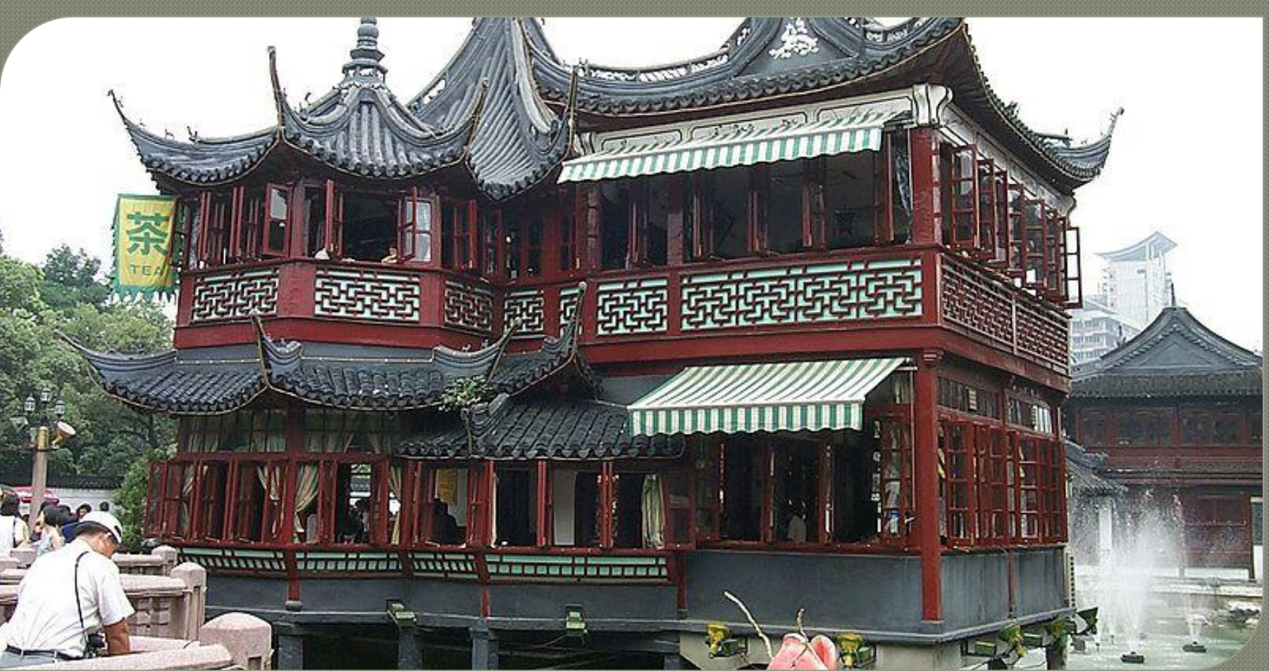
Чайный дом в Шанхае