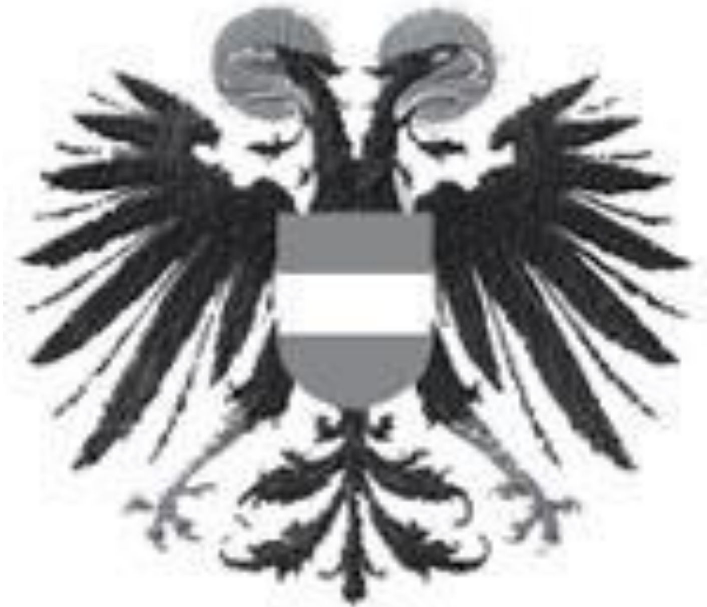
герб Священной Римской Империи