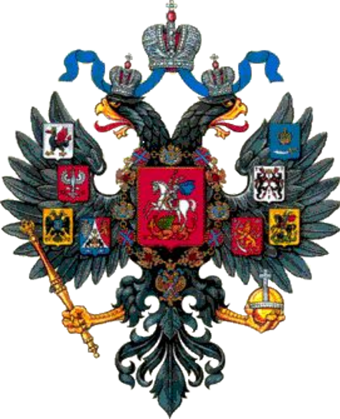
Малый Государственный Герб Российской Империи 1883 г