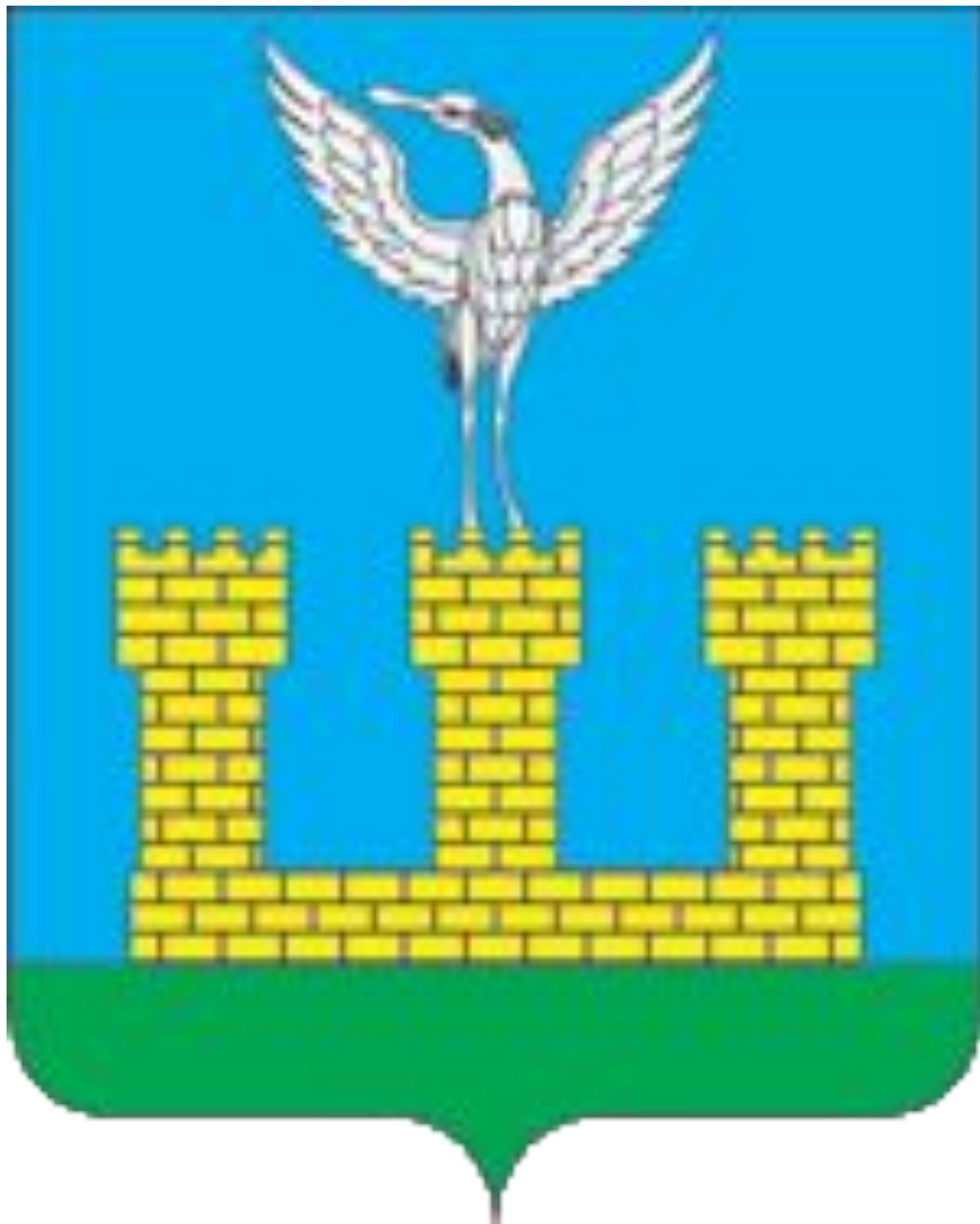
Герб городского поселения Шаховская