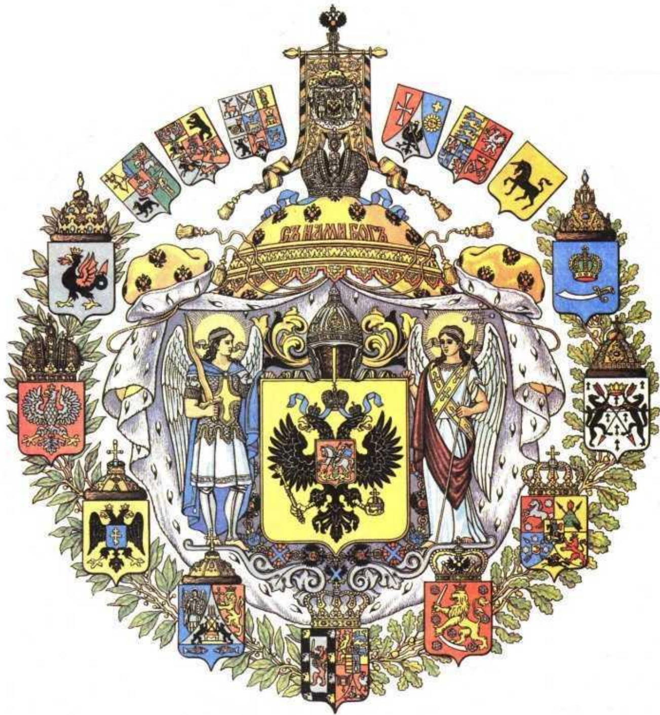
Большой Государствен ный герб Российской Империи