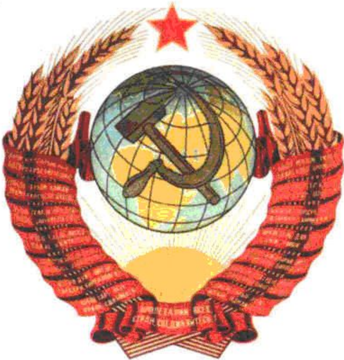
Государствен ный герб СССР