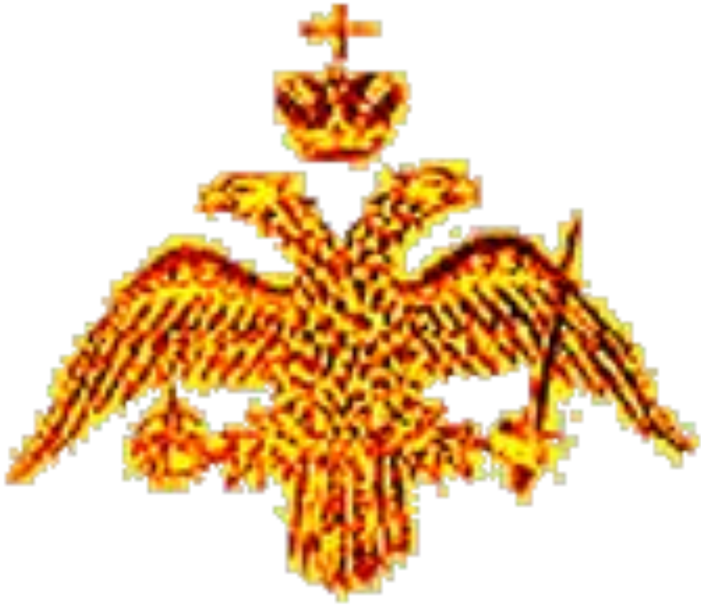
Герб Византийской империи