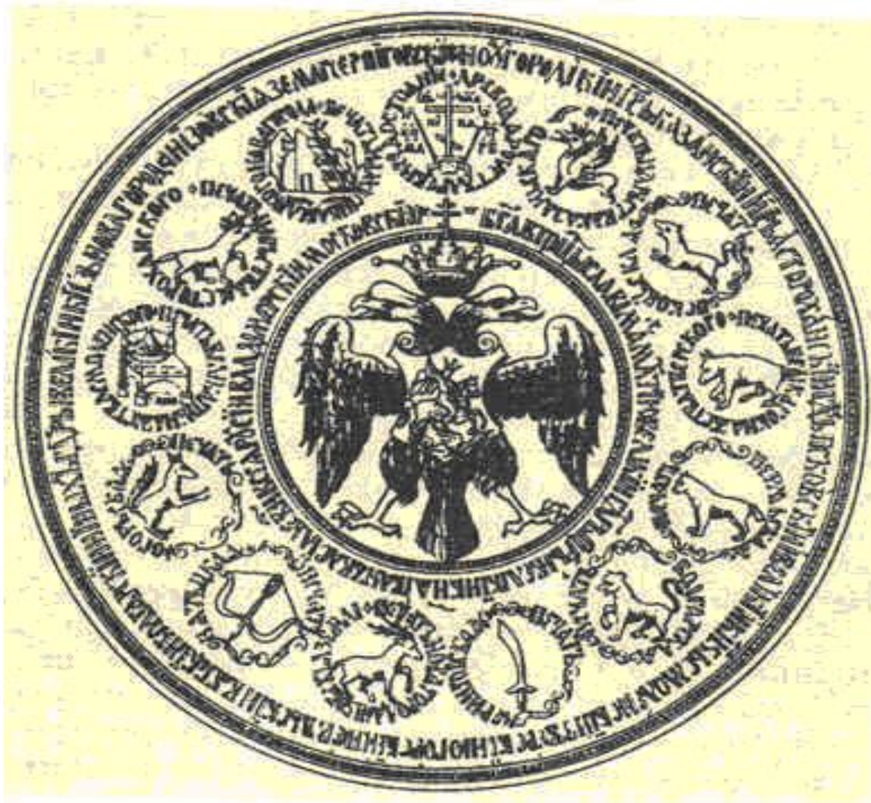
большая государственная печать 1577г.