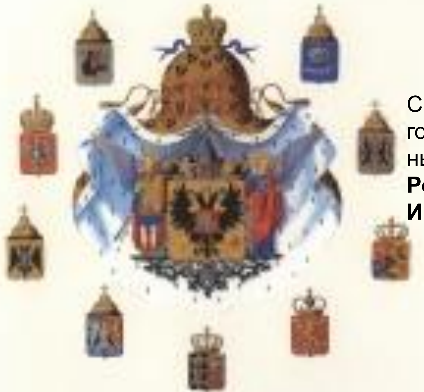
Средний государствен ный герб Российской Империи