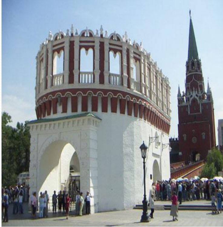
Кутафья и Троицкая башни Московского Кремля

Если пройти чуть дальше вдоль стен Кремля, то мы увидим Троицкий мост. Его перекинули через реку Неглинную много столетий назад, ещё до того как она была спрятана под землю. Троицкий мост ведёт к воротам одной из самых высоких кремлёвских башен – Троицкой . Мост соединяет Троицкую башню с другой – низкой и широкой башней. Это Кутафья башня . В старину так называли неуклюже одетую женщину. Башню принарядили уже в семнадцатом столетии. До этого Кутафья была очень суровой, с подъёмными мостами у боковых ворот и навесными бойницами. Она охраняла въезд на Троицкий мост. Раньше таких предмостных башен было больше. Но до наших дней сохранилась только одна. Высота Троицкой башни со звездой - 80 м. Это самая высокая башня Московского Кремля. Кутафья башня в высоту всего 13,5 м. Это самая низкая башня Кремля.