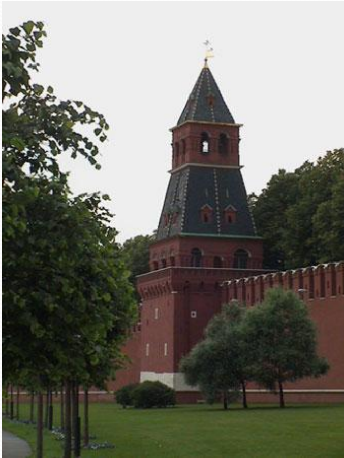
Благовещенская башня Московского Кремля

Благовещенская башня. По легенде в этой башне раньше хранилась чудотворная икона «Благовещение», а также в 1731г. к этой башне пристроили церковь Благовещения. Скорее всего, название башни связано с одним из этих фактов. В 17в. для прохода прачек к Москве-реке возле башни были сделаны ворота, названные Портомойными. В 1831г. их заложили, а в советское время разобрали и церковь Благовещения. Высота Благовещенской башни с флюгером 32,45 м.