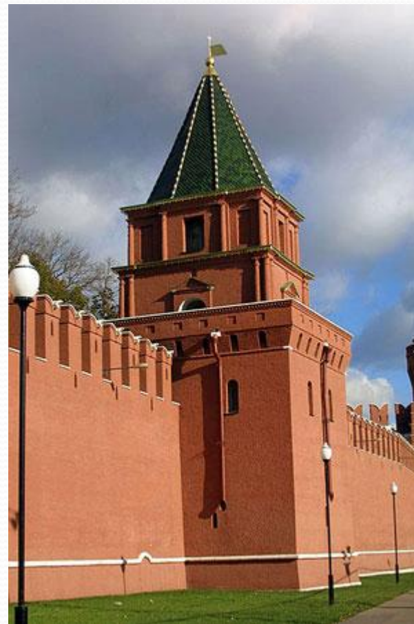
Петровская башня Московского Кремля

Петровская башня вместе с двумя безымянными была построена для усиления южной стены, как наиболее часто подвергавшейся нападению. Как и две безымянные Петровская башня сначала не имела названия. Имя своё она получила от церкви митрополита Петра на Угрешском подворье в Кремле. В 1771г. во время строительства Кремлёвского дворца башню, церковь митрополита Петра и Угрешское подворье разобрали. В 1783г. башню отстроили заново, но в 1812г. французы во время оккупации Москвы уничтожили её снова. В 1818г. Петровскую башню снова восстановили. Её использовали для своих нужд кремлёвские садовники. Высота башни 27,15м.