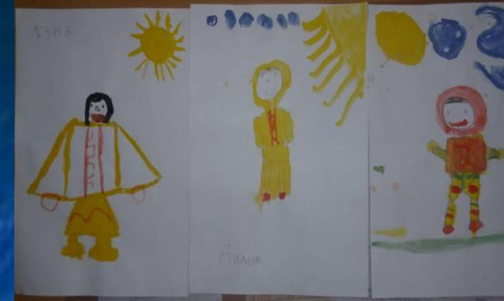
Рисование орнамента на одежде