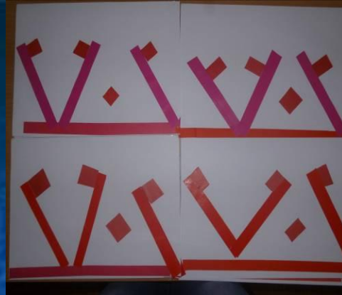
Орнамент «Заячы уши»