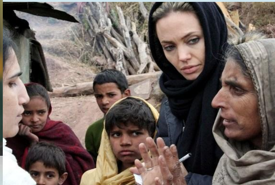
Анджелина Джоли, (США)