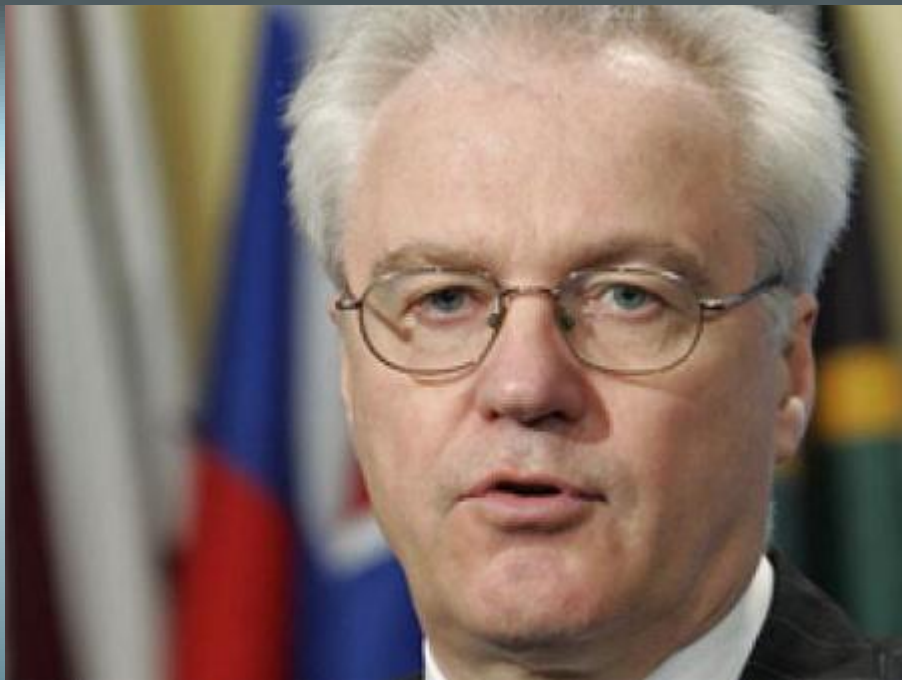
Виталий Чуркин, (Россия)