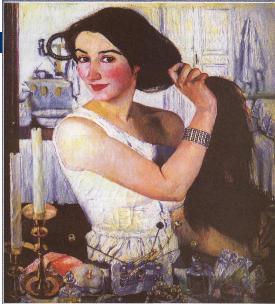
З. Е. Серебрякова (1884—1967). За туалетом. Автопортрет. 1909 г. ГТГ