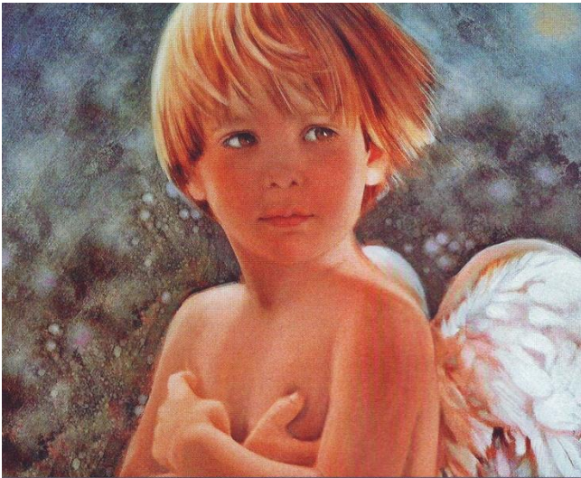
Ноэль Нэнси. Ангел. 2003