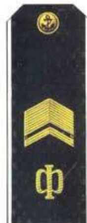
Главный корабельный старшина