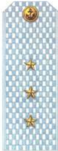
Старший мичман (парадная форма одежды, ВМФ)