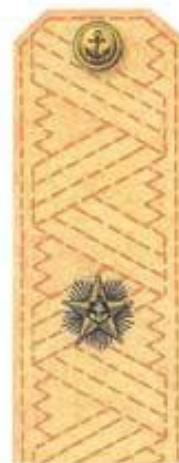
Контр-адмирал (повседневная форма одежды)