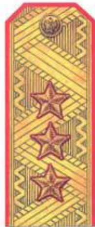
Генерал-полковник (парадная форма одежды)