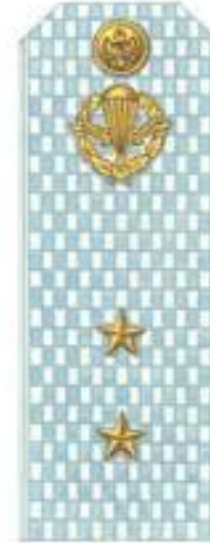
Прапорщик (парадная форма одежды, ВДВ)