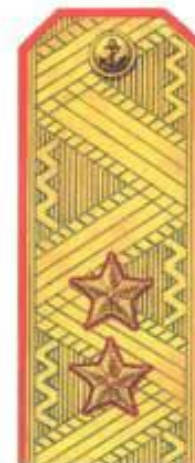
Генерал-лейтенант (парадная форма одежды, береговые войска)