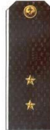
Мичман (повседневная форма одежды, ВМФ)