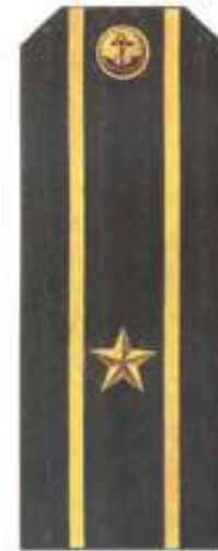
Капитан 3 ранга (повседневная форма одежды)