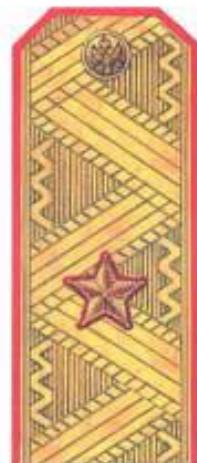
Генерал-майор (парадная форма одежды)