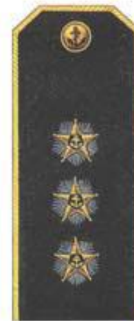
Адмирал (повседневная форма одежды)