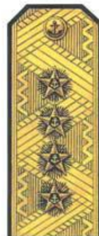
Адмирал флота (парадная форма одежды)