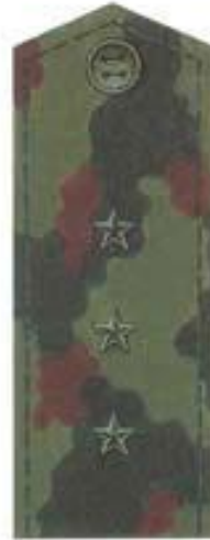
Старший прапорщик (полевая форма одежды)