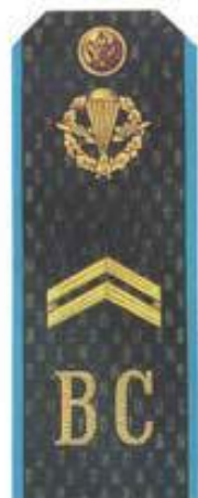
Младший сержант (ВДВ)