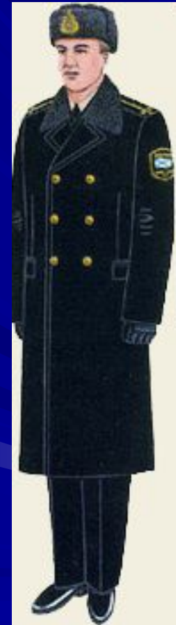
повседневная для строя и вне строя