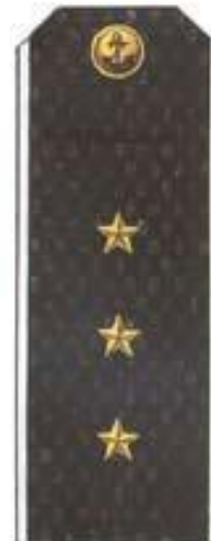
Старший мичман (повседневная форма одежды, ВМФ)