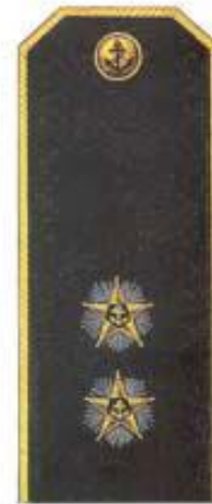
Вице-адмирал (повседневная форма одежды)