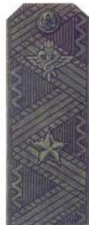
Генерал-майор (полевая форма одежды)