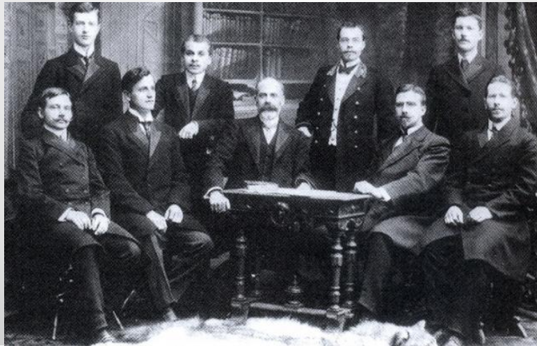
Заседание правления «Маяка»