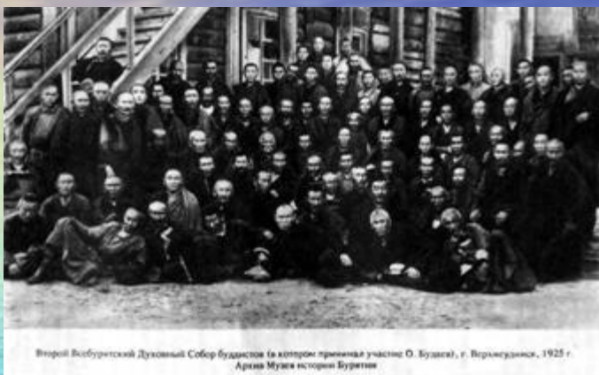
Второй Всебуриятский Духовный Собор буддистов (в котором приняла участие О. Будаска), г. Верхнеудинск, 1925 г.