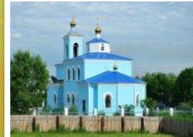
Храм Покрова Пресвятой Богородицы