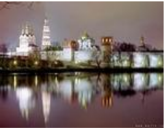
Храм Василия Блаженного