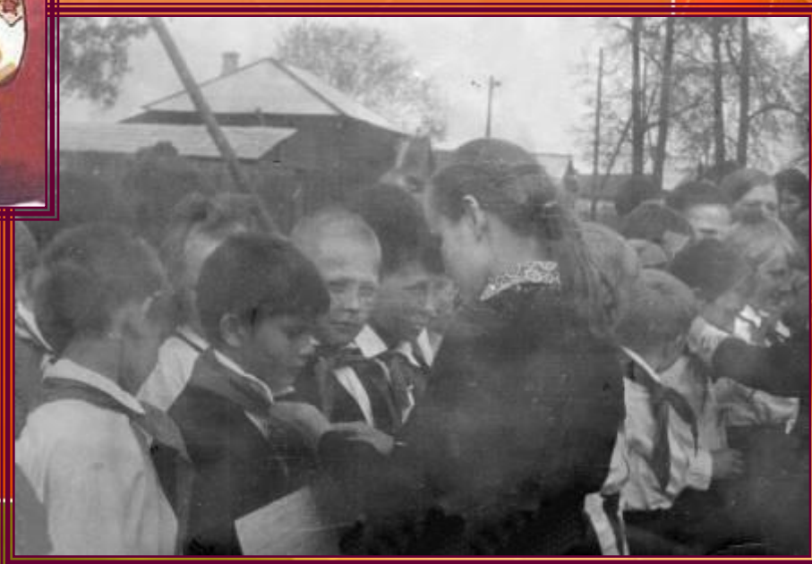
Торжественный прием в пионеры