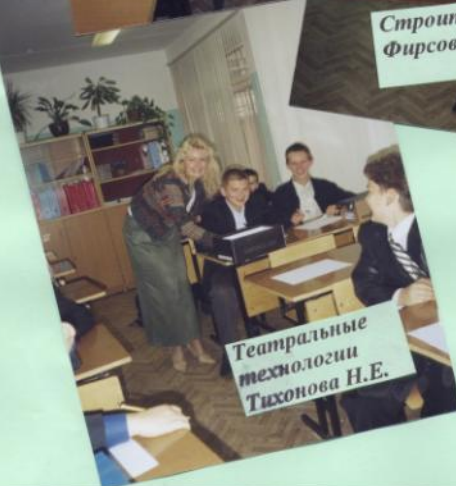
Театральные технологии Тихонова Н.Е.