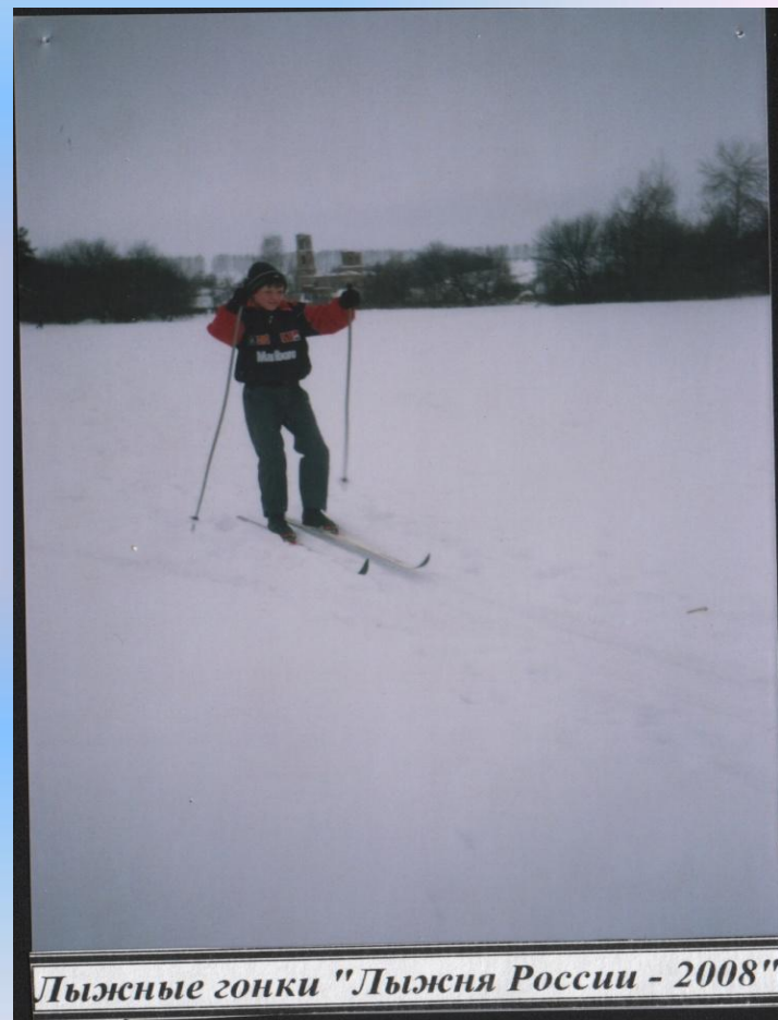
Лыжные гонки "Лыжня России - 2008"