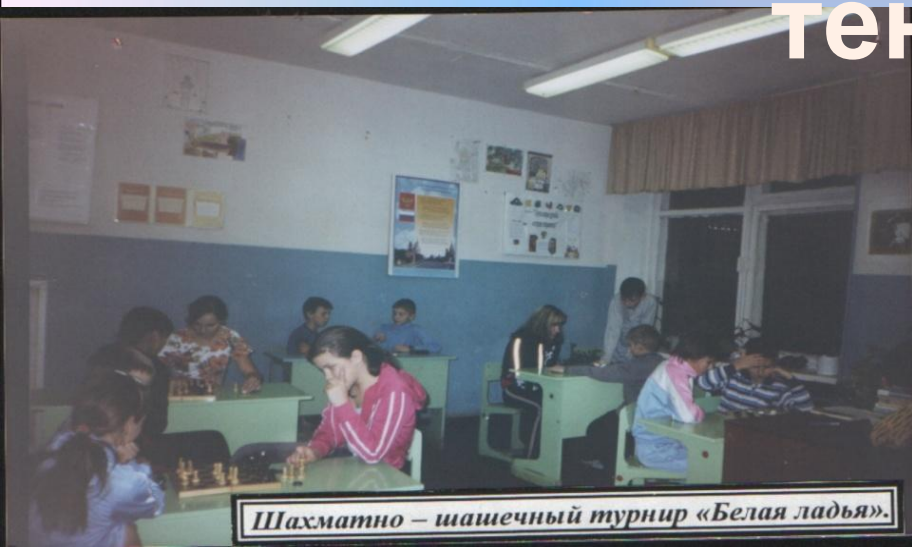
Шахматно – шашечный турнир «Белая ладья».

Дети любят прыгать, играть в волейбол, шашки, настольный теннис.