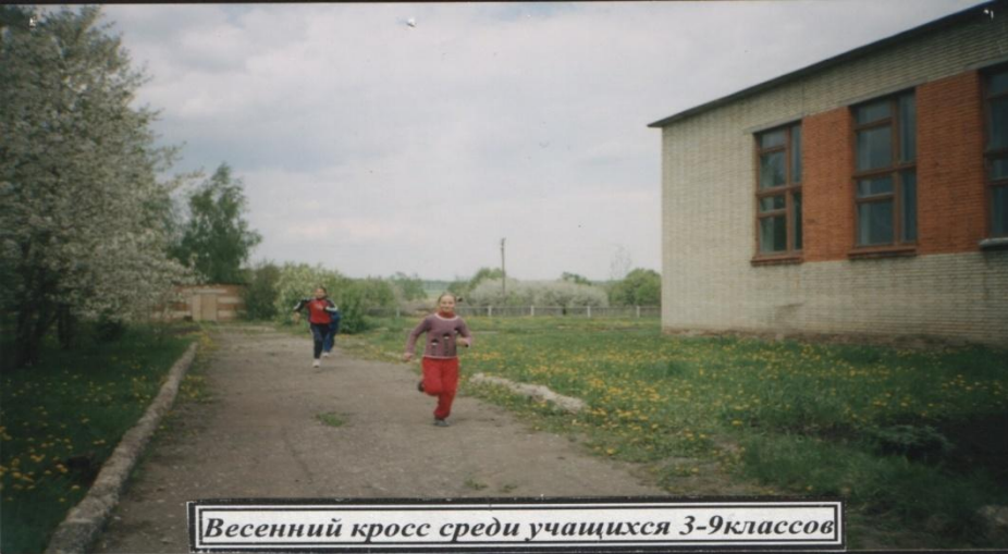
Весенний кросс среди учащихся 3-9 классов