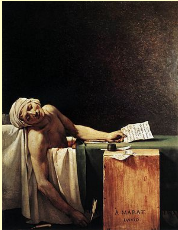
Жак Луи Давид. Смерть Марата, 1793

Задание: по фактам биографии определить личность, о которой идет речь.