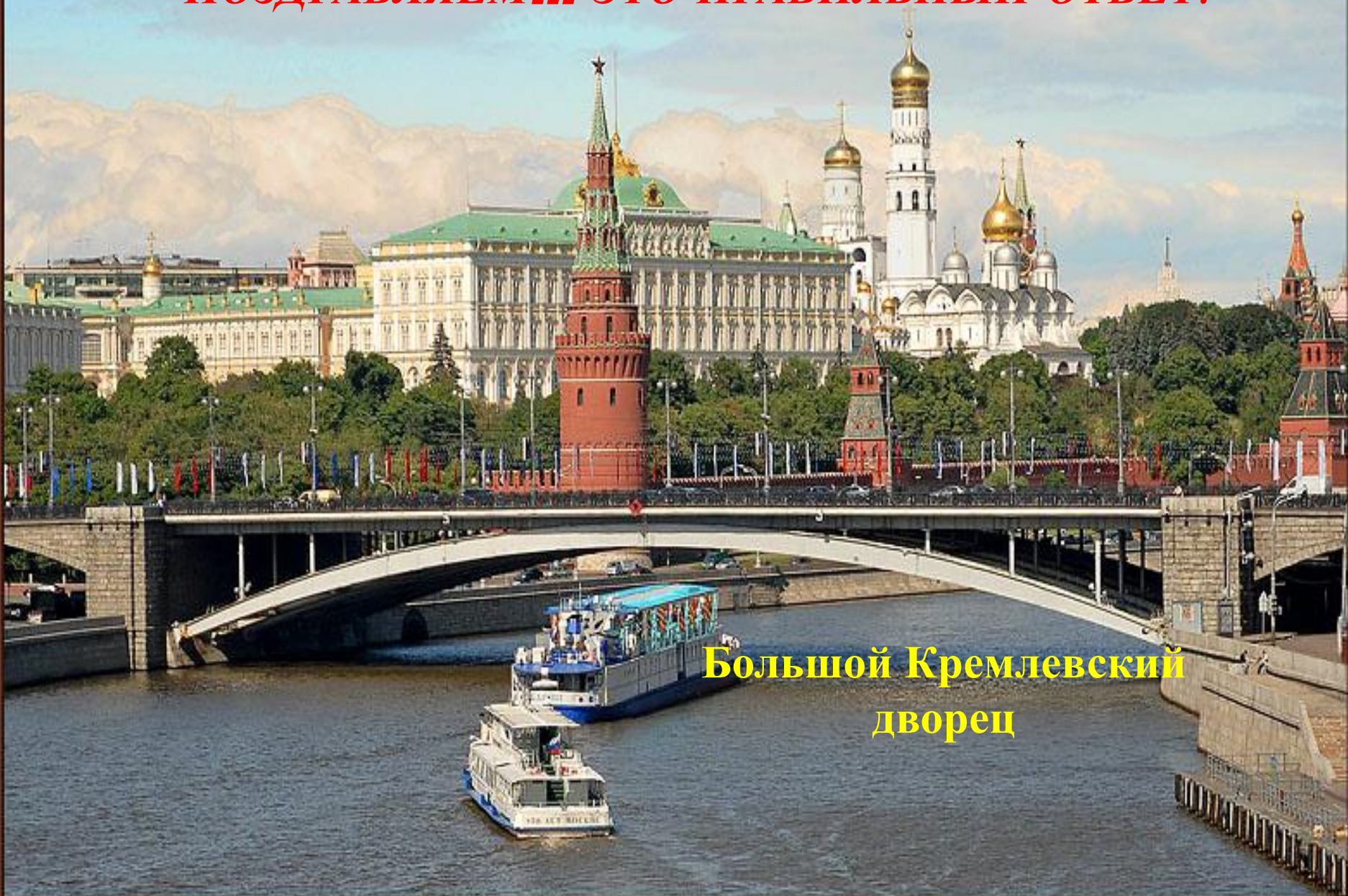
Большой Кремлевский дворец