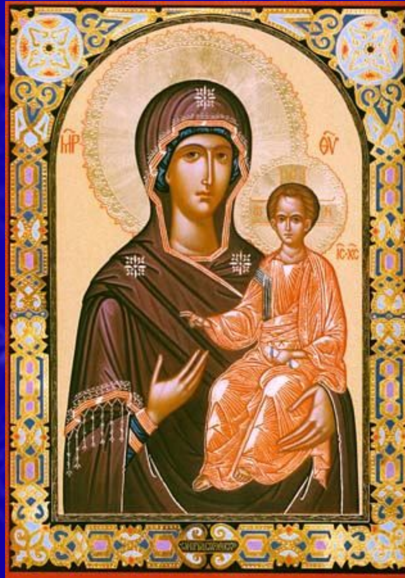
Икона Божьей Матери