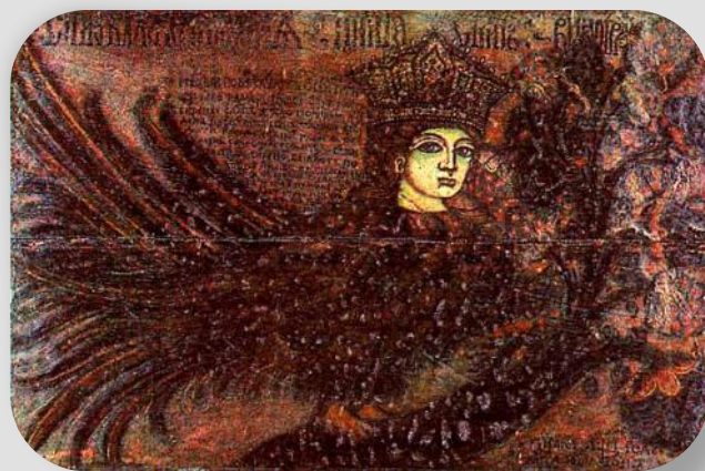
РИСУНОК НА КРЫШКЕ СУНДУКА

Одним из древнейших образов в русском народном искусстве являются птицы с красивыми женскими головами . Их рисовали на сундучках и прялках, вырезали на избах и чеканили на женских подвесках. Кто они и от куда пришли? Попробуем разобраться.