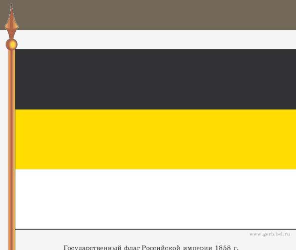
Государственный флаг Российской империи 1858 г.