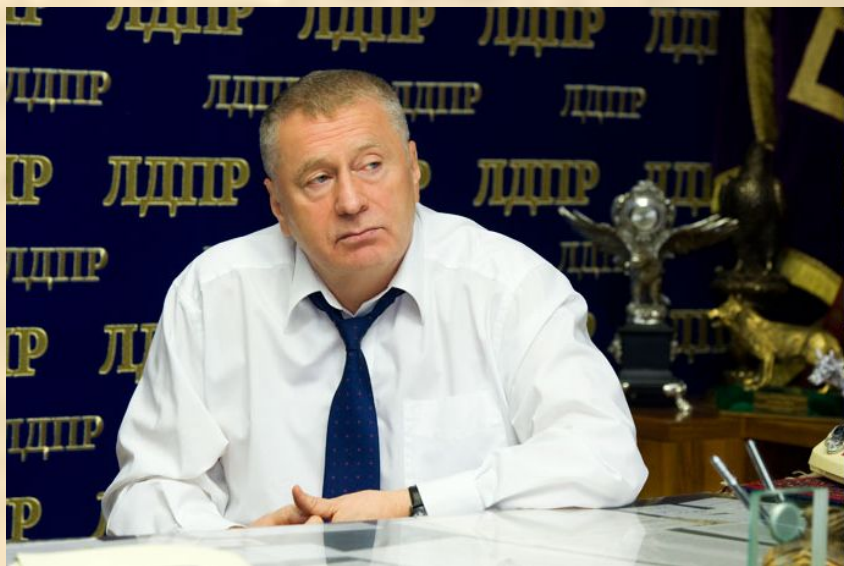
Председатель - ЖИРИНОВСКИЙ Владимир Вольфович.