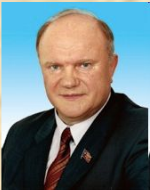
Председатель – ЗЮГАНОВ Геннадий Андреевич.