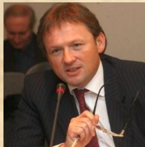
Титов Борис Юрьевич