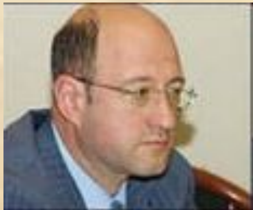
Бабаков Александр Михайлович