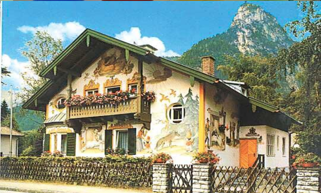
Lustig und entspannend!