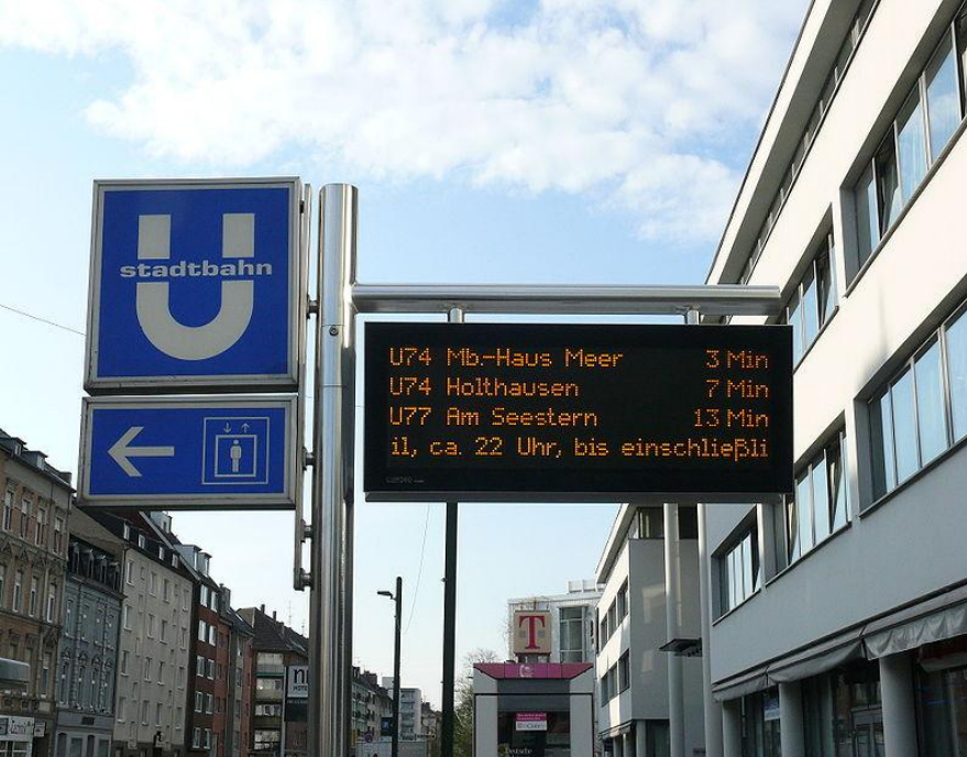
Ordnung muss sein!