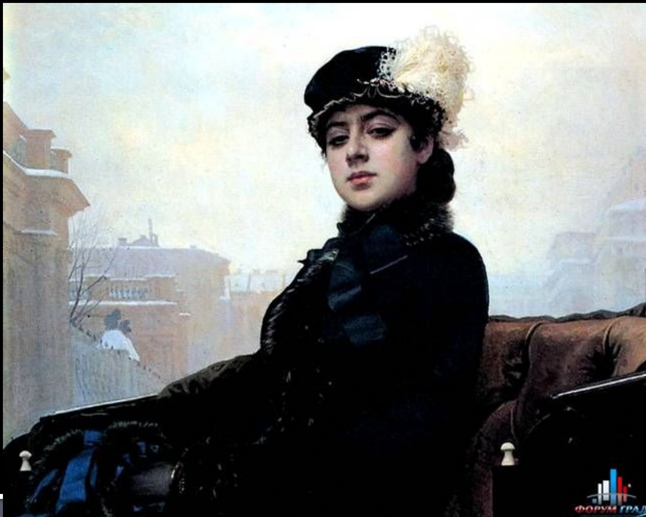
И.Н.Крамской. Портрет неизвестной