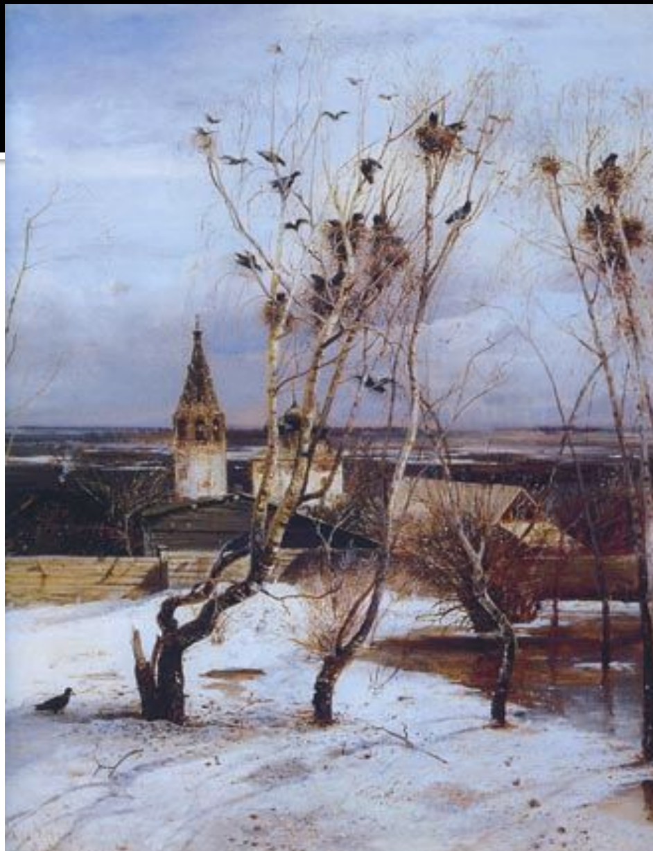
А.Саврасов. ГРАЧИ ПРИЛЕТЕЛИ.