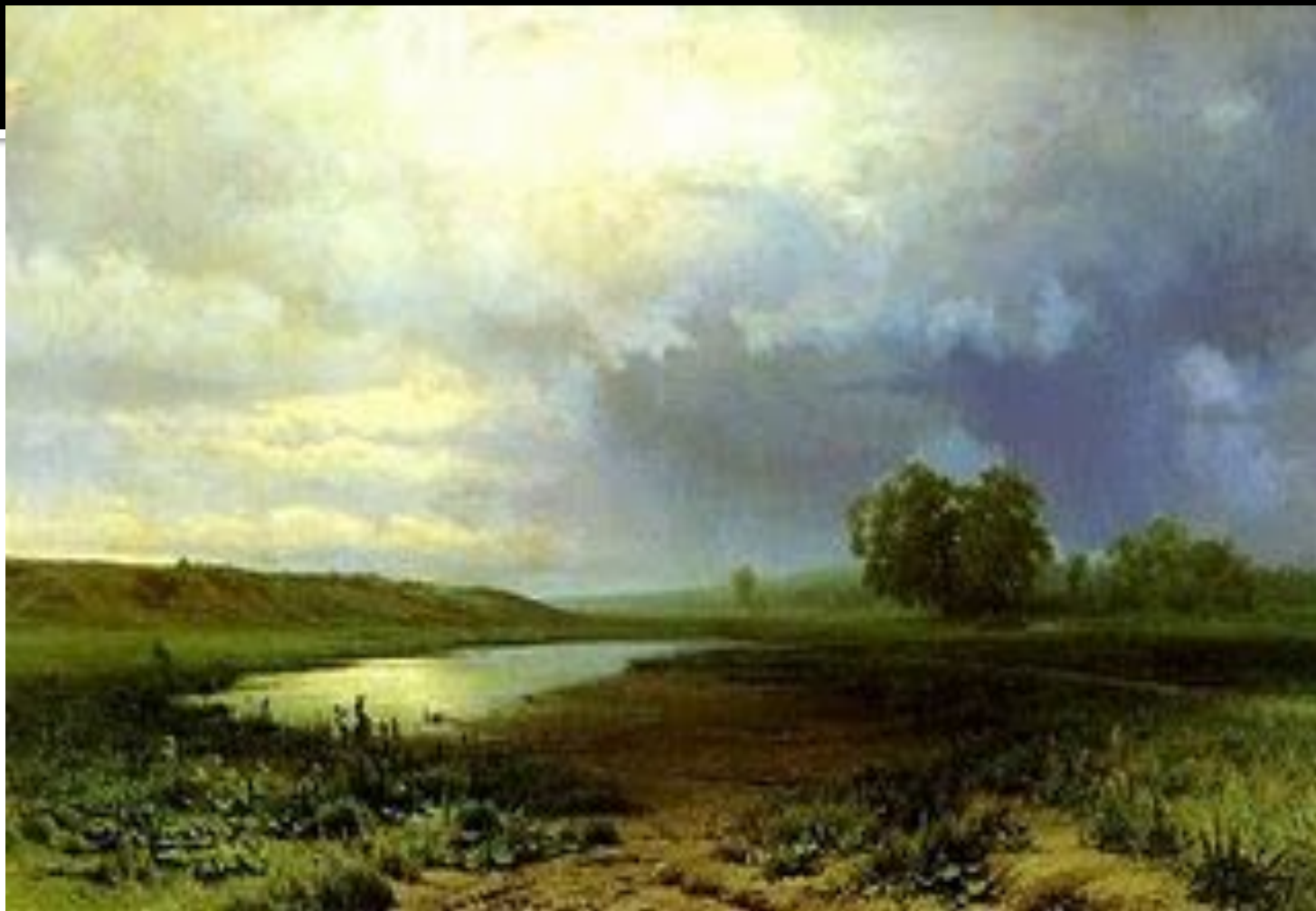
Ф.Васильев. МОКРЫЙ ЛУГ.