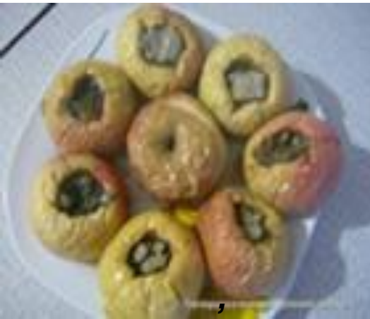
Die Bratäpfel im Backofen