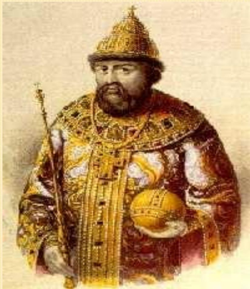
Русский посол Василий Старков.