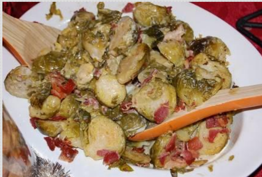
Брюссельская капуста в сливках и беконом.