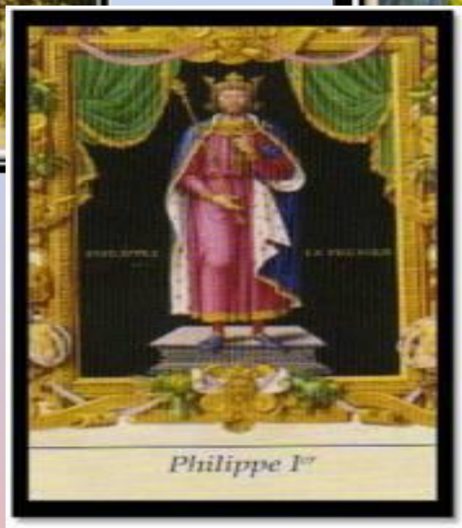
Philippe I er