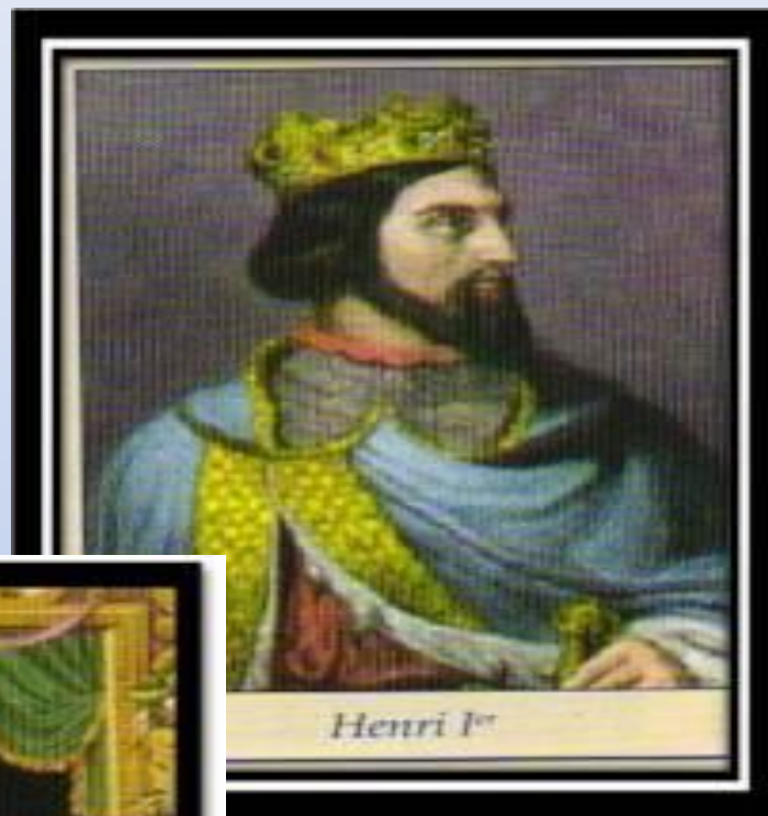
Henri I er