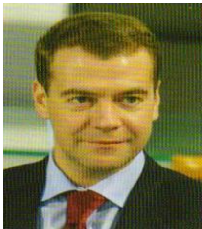
Николя Саркози, Президент Французской Республики

« Открыть новые и полезные перспективы сотрудничества»