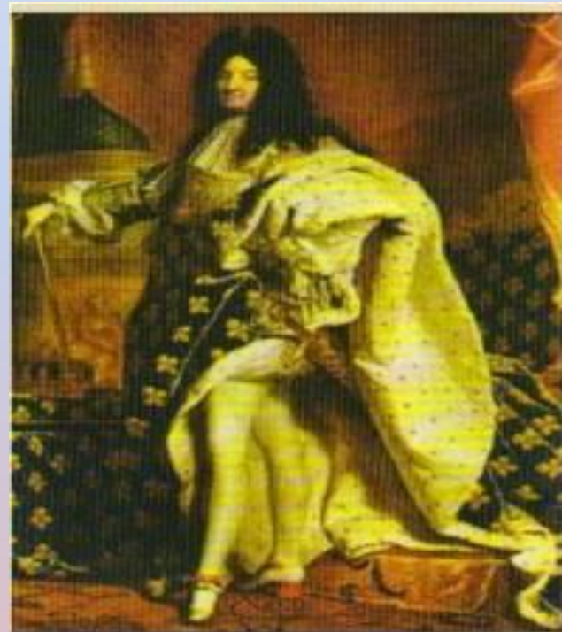
Louis XIV (1638-1715)