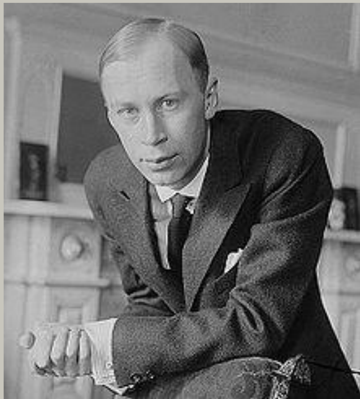
Сергей Прокофьев (1891 – 1953)