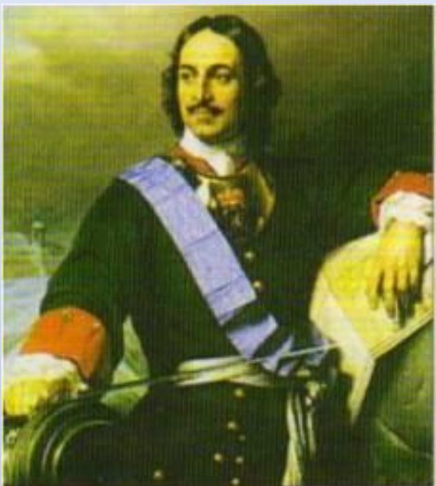
Pierre I er (1672-1725)