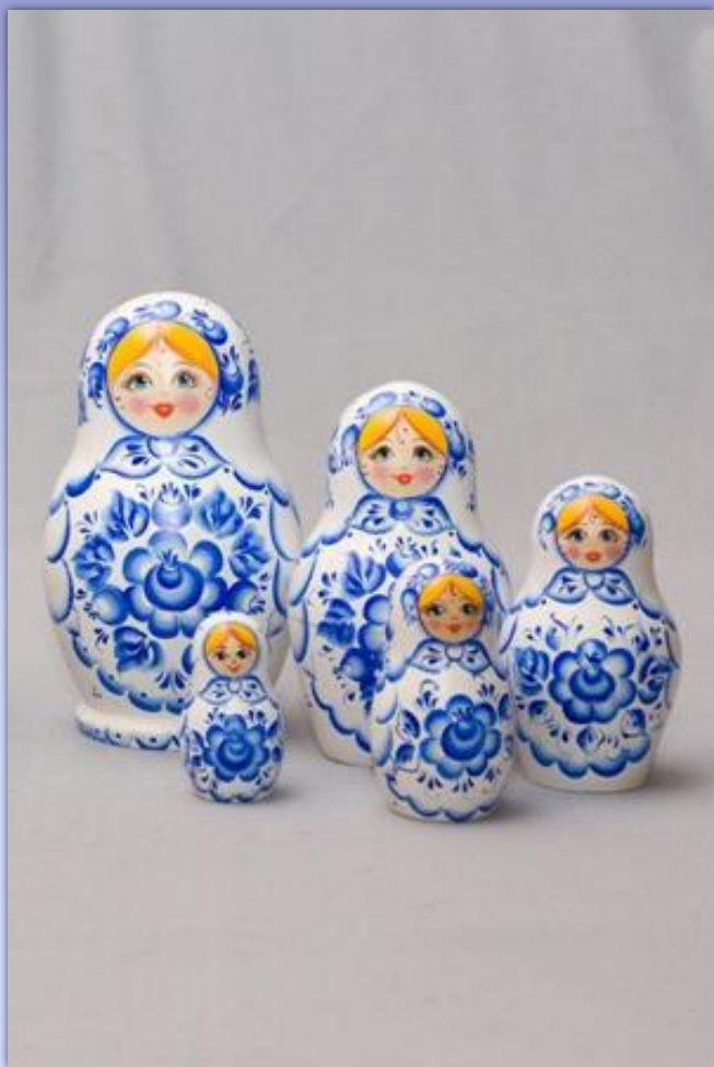
В стиле росписи «Гжель»