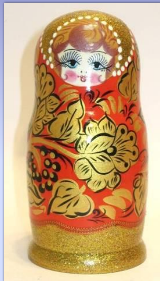
В стиле росписи «Хохлома»