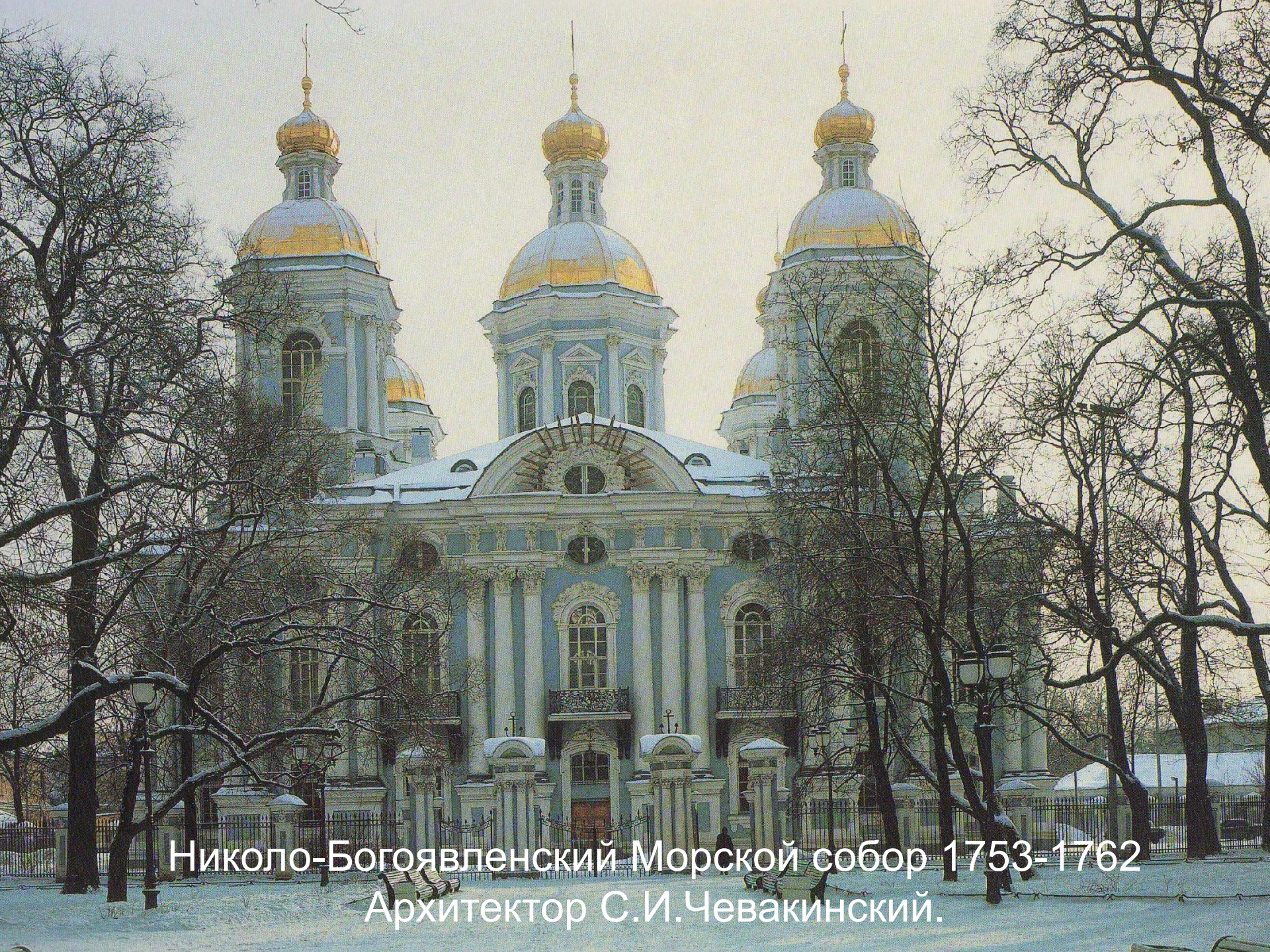
Никола-Богоявленский Морской собор 1753-1762 Архитектор С.И.Чевакинский.