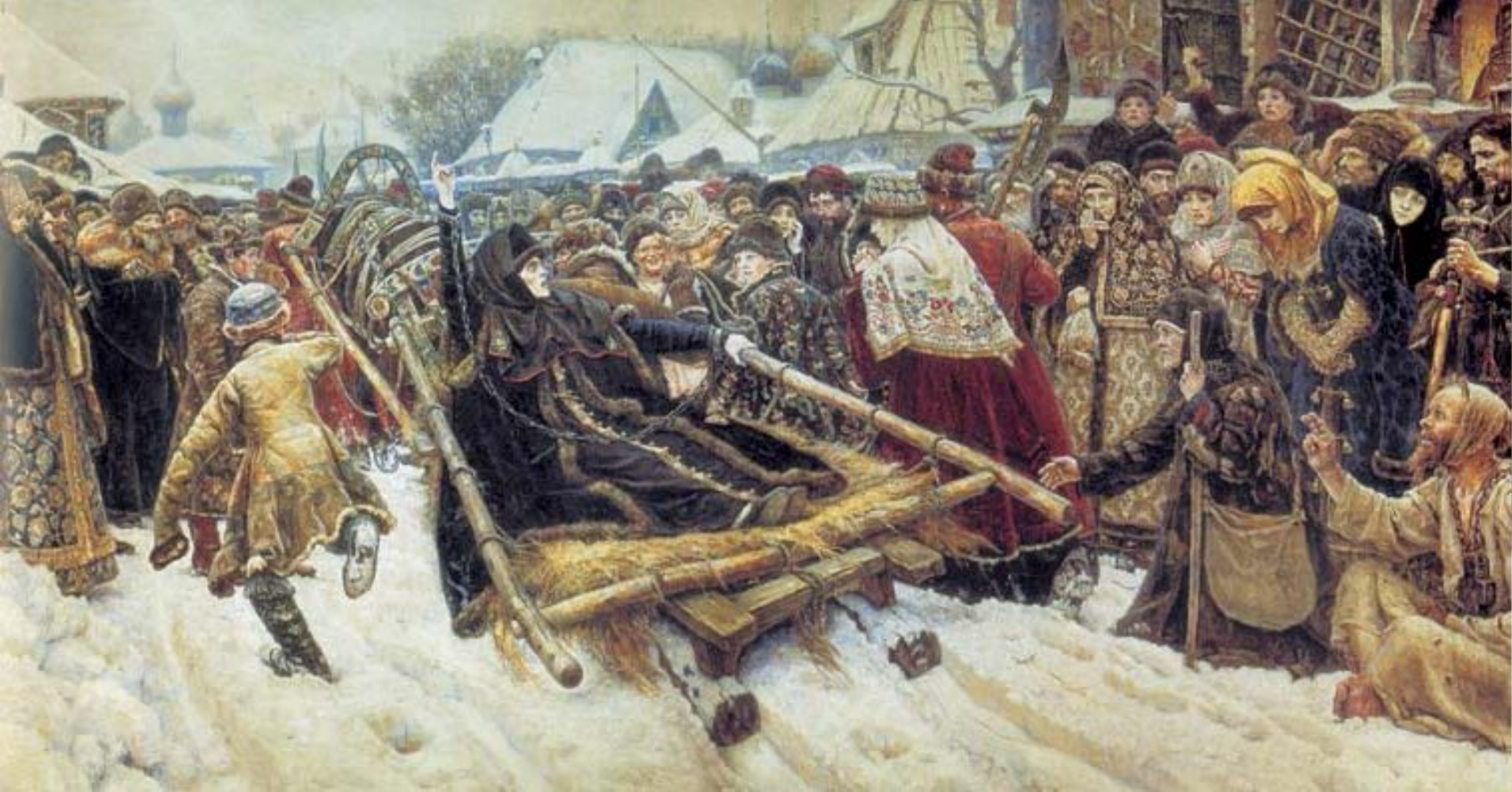
В.И. Суриков. Боярыня Морозова. 1887 г.

Боярыня Морозова была противницей реформ патриарха Никона, тесно общалась с апологетом старообрядчества - протопопом Аввакумом