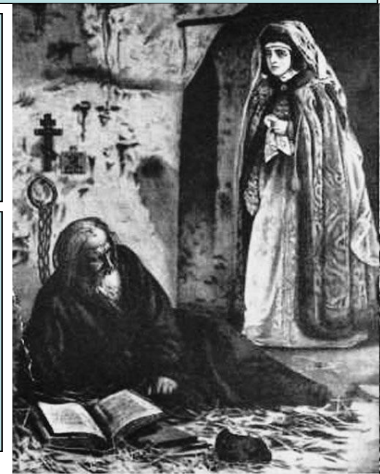
Боярыня Морозова навещает протопопа Аввакума в тюрьме.

Сторону «ревнителй» принимали многие знатные и богатые бояре, церковные иерархи, крестьяне и посадские люди. В Москве происходили волнения противников реформ Никона